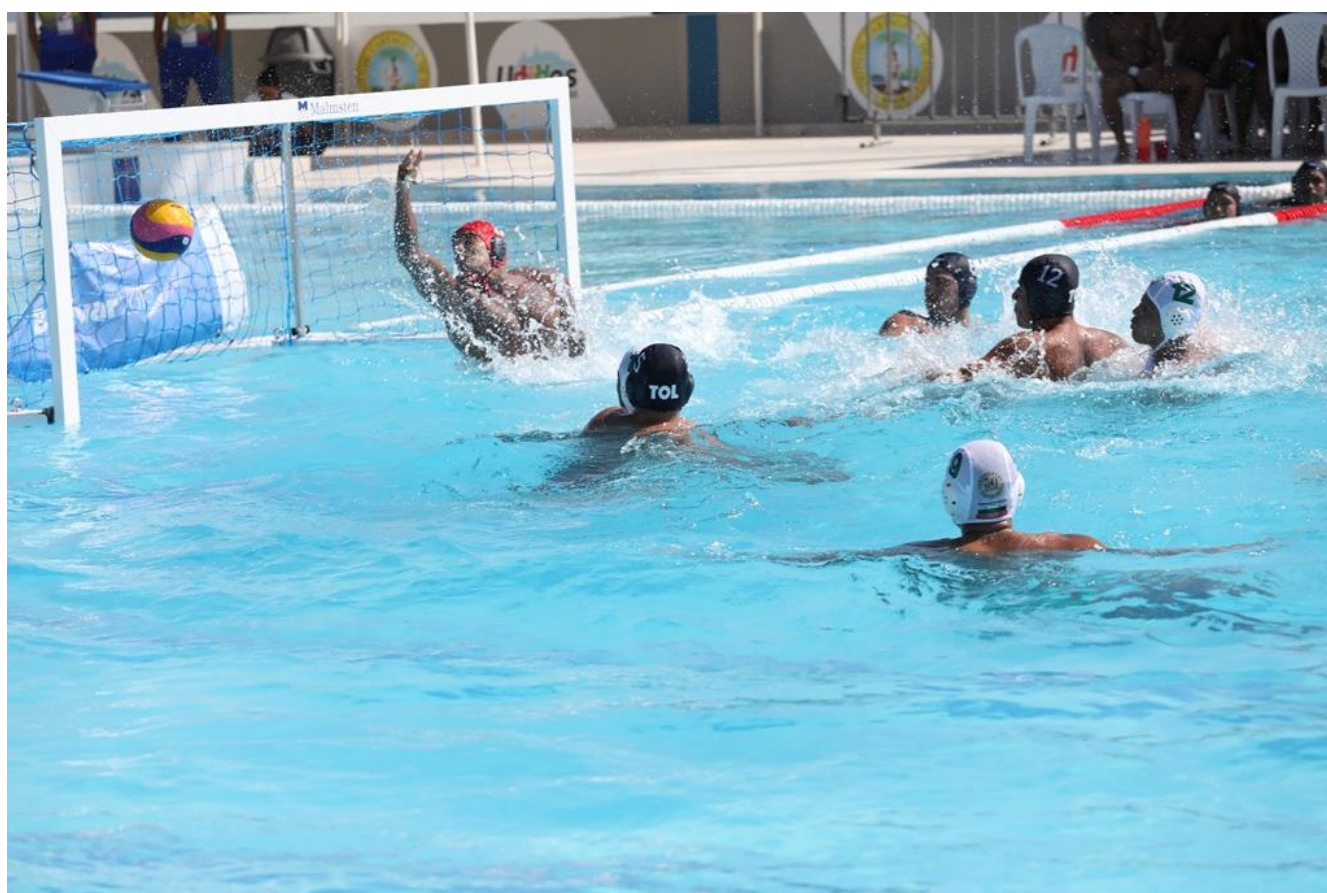
Hoy, Antioquia 9 – Tolima 6 en polo acuático.