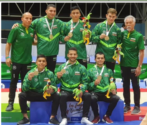
Equipo campeón de gimnasia artística masculina.

En la segunda jornada de la gimnasia artística de los juegos que tuvo lugar en el coliseo gimnástico de la unidad deportiva de la heroica, Antioquia obtuvo una medalla de oro con el equipo masculino. Las gimnastas de Bogotá se colgaron la otra medalla dorada.