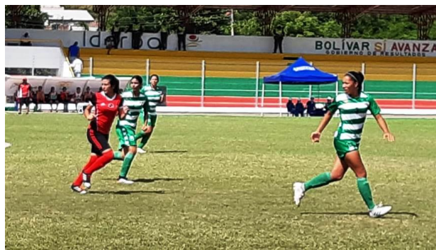
Antioquia 3 – Norte de Santander, 0.

En esta disciplina colectiva y luego de superar la ronda de clasificación en la fase de todos contra todos, este martes habrá jornada de descanso. El próximo miércoles se jugará, a las 2:00 p.m. la primera semifinal entre Antioquia y Meta y a las 4:00 p.m. Valle de Cauca contra Norte de Santander. La final se llevará a cabo el próximo jueves 21 de noviembre a las 4:00 p.m.