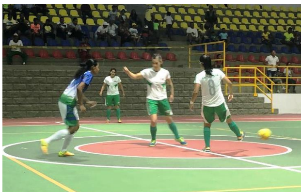
Antioquia 6 – Córdoba 1 en fútbol de salón.

Por: Carlos Arturo Castañeda Quant – periodista de Indeportes Antioquia en Magangué