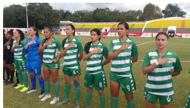
Antioquia, campeón de fútbol femenino.

Cuerpo técnico: Jaime Hoyos (entrenador), Juan Camilo Arango (preparador físico) y Alejandro Orrego (kinesiólogo).