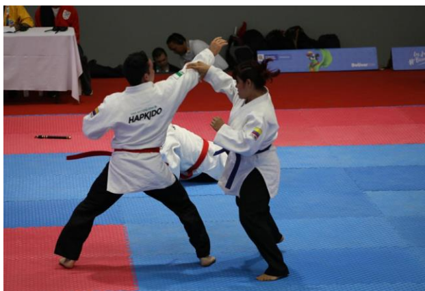
En la imagen, competencias de hapkido en acción.

En la tercera fecha del hapkido, Antioquia ganó una medalla de oro, fue segundo (plata), en tres oportunidades y, tercero, en una ocasión (bronce).