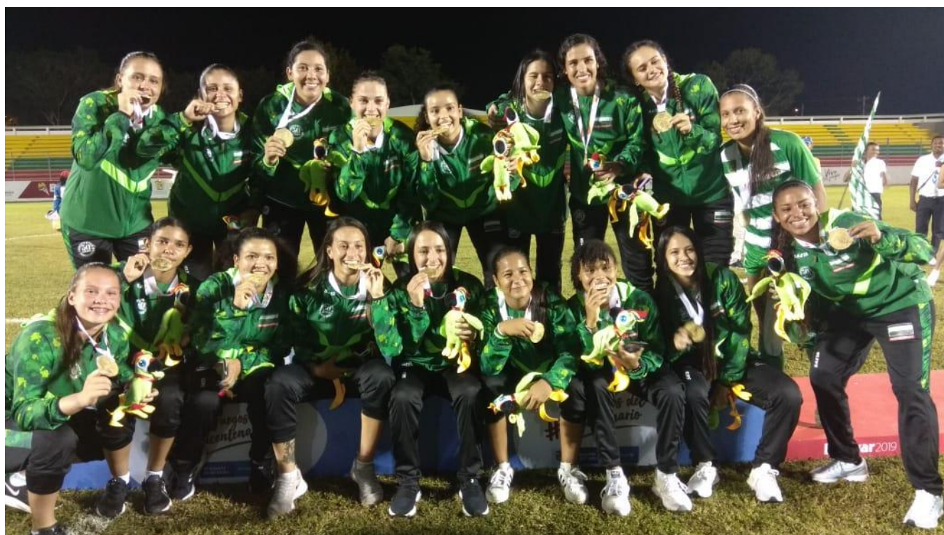
En la imagen, equipo de fútbol femenino de Antioquia que en la final venció al Valle del Cauca 1-0.

XXI Juegos Deportivos Nacionales y V Paranales de 2019 Antioquia sigue al frente del tablero general de medallería con 60 oros, 49 platas y 33 bronce. Ahora, Valle del Cauca es segundo y Bogotá es tercero. Bolívar ascendió al cuarto lugar. Antioquia, campeón en fútbol femenino en Carmen de Bolívar. En Cartagena, título para la Selección Antioquia de rugby siete femenina. El tiro con arco le entregó el jueves seis medallas de oro al departamento. También hubo medallas de oro en patinaje, clavados, hapkido y lucha. Fútbol de salón femenino y voleibol masculino van por las medallas de bronce. En Arjona, Antioquia disputará ante Bogotá la semifinal en fútbol sala femenino. Este viernes comienzan actividades subacuáticas, balonmano masculino y esquí náutico.