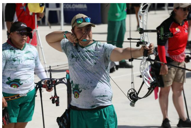
Tiro con arco.

En el tercer día de competencias del tiro con arco, la delegación que representa al departamento de Antioquia obtuvo seis medallas de oro, dos de plata y una de bronce.