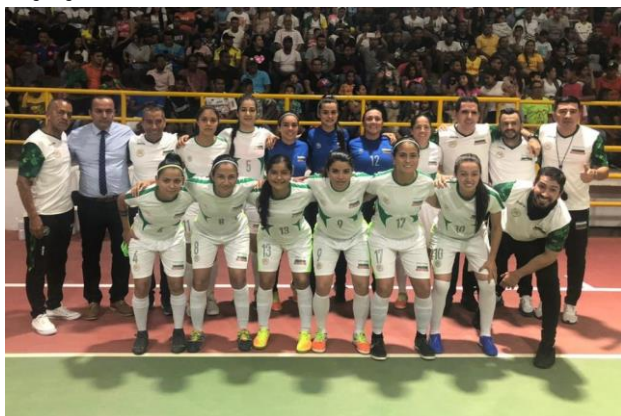
En la imagen, equipo de fútbol de salón femenino de Antioquia.

Por: Carlos Arturo Castañeda Quant - Periodista de Antioquia en Magangué.