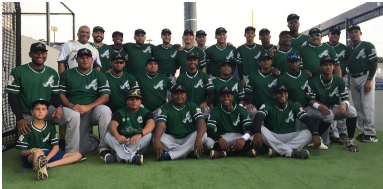
En la imagen, equipo de béisbol de Antioquia que está listo para las semifinales. Espera rival.