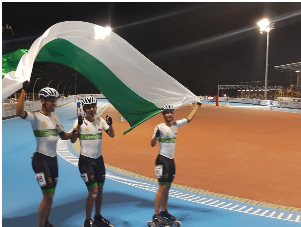
Patinaje oro de Antioquia.

Las competencias continúan este viernes 22 con seis pruebas.