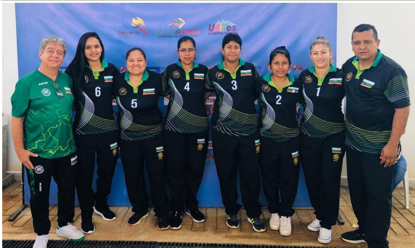
En la imagen, equipo femenino de tejo de Antioquia, medalla de oro.

Este domingo comienza la 5ª edición de los Juegos Paranales. Antioquia presentará 288 para atletas