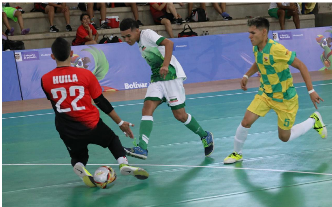
Antioquia 3 – Huila 0 en la segunda fecha de fútbol sala masculino auditivo.