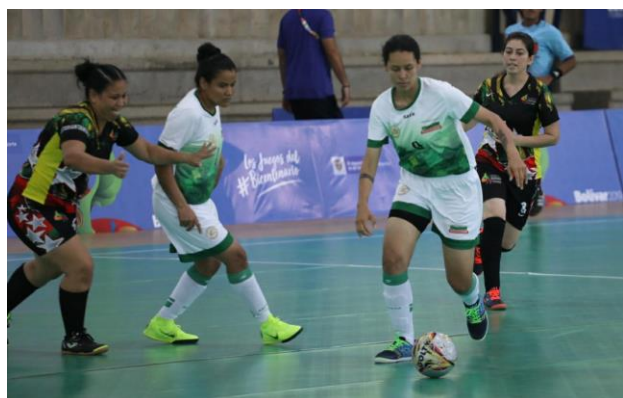
Antioquia 10 – Santander 1. Fútbol sala.

Por Jaime Humberto Herrera Correa – Periodista de Antioquia en Cartagena.