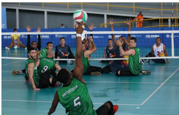
Antioquia 3 – Bogotá 0 en voleibol sentado.

Por Jaime Humberto Herrera Correa – Periodista de Antioquia en Cartagena.