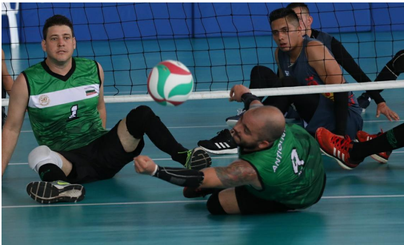
El voleibol sentado genera emociones y mucho espectáculo.