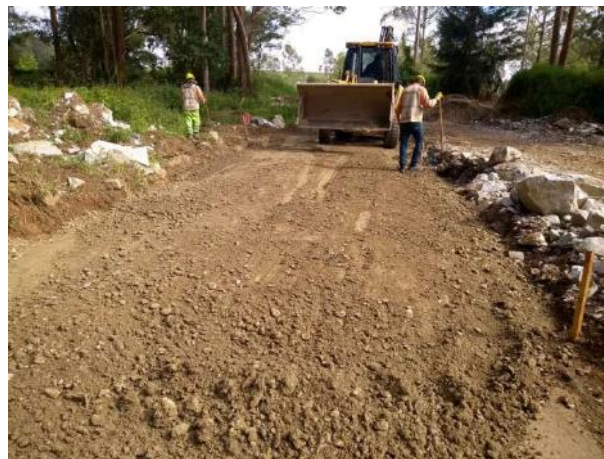
Km2+600 al km2+490