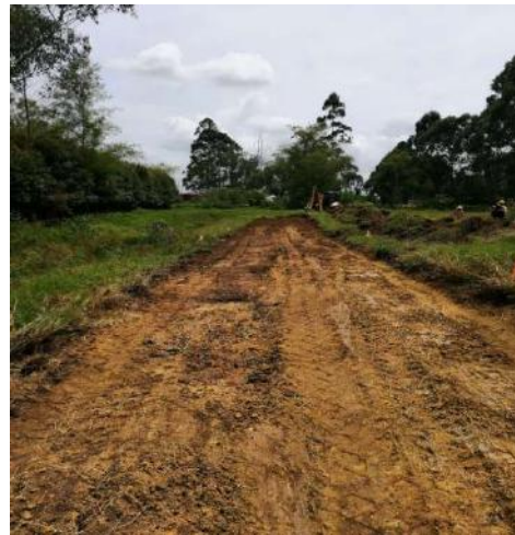
Abs Km 0 + 272 al Km 0+ 160