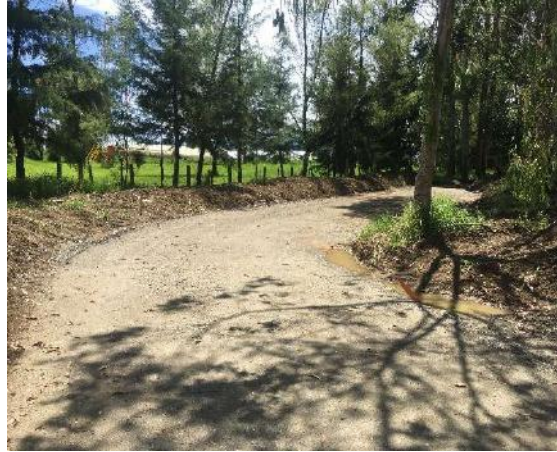
Km2+630 al km2+830