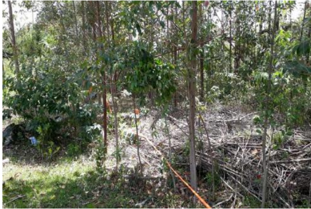
KM0+000 la Km0+325

Con respecto a lo anterior, solo se cuenta con un frente de trabajo y con dos retroexcavadoras, un (1) vibro compactador, 2 oficiales y 5 ayudantes, adicionalmente, se evidencia la falta de material en obra y personal que permita un avance continuo y adecuado del proyecto.