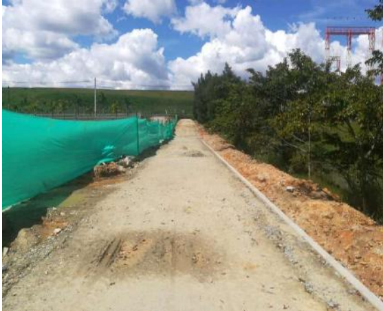
Km2+950 al km3+045