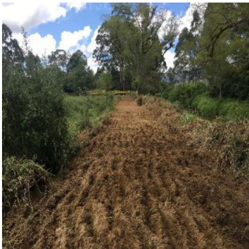
Abs Km 0 + 000 al Km 0+ 150