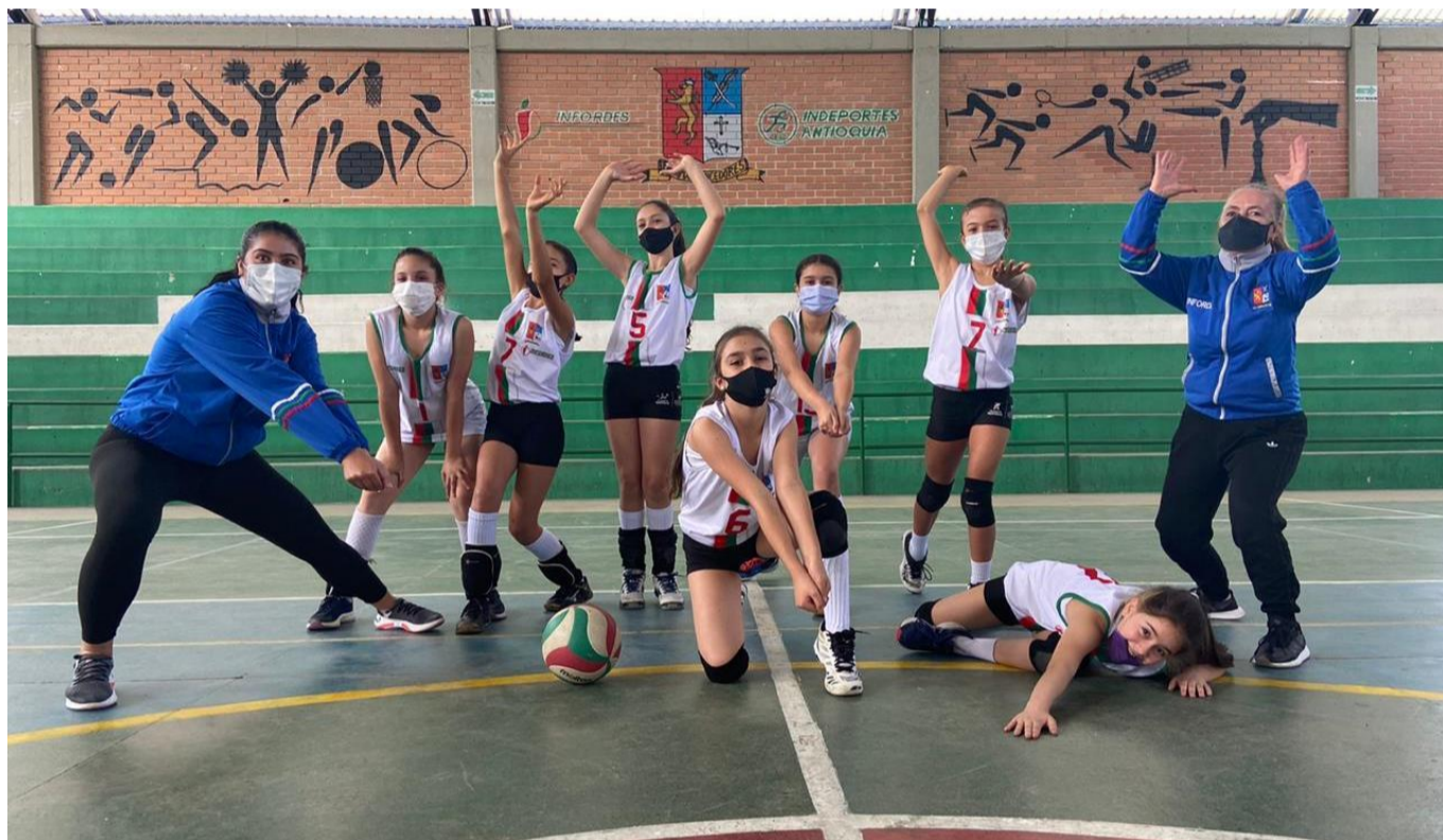
(Arriba El Santuario campeón de voleibol femenino y abajo competencia de tenis de campo entre Envigado y San Pedro de Los Milagros)

30° Juegos Deportivos Escolares Virtuales “Indeportes Antioquia 2020” – Final Departamental El Santuario, campeón en voleibol femenino. Medellín y Carolina del Príncipe ganaron ajedrez. En levantamiento de pesas reinó Carepa. Nadadores de Girardota, primeros en natación carreras. Este sábado se corren las pruebas de atletismo. También finales en baloncesto, fútbol de salón, fútbol sala y fútbol. En tenis de mesa, listos los finalistas en ambas ramas.