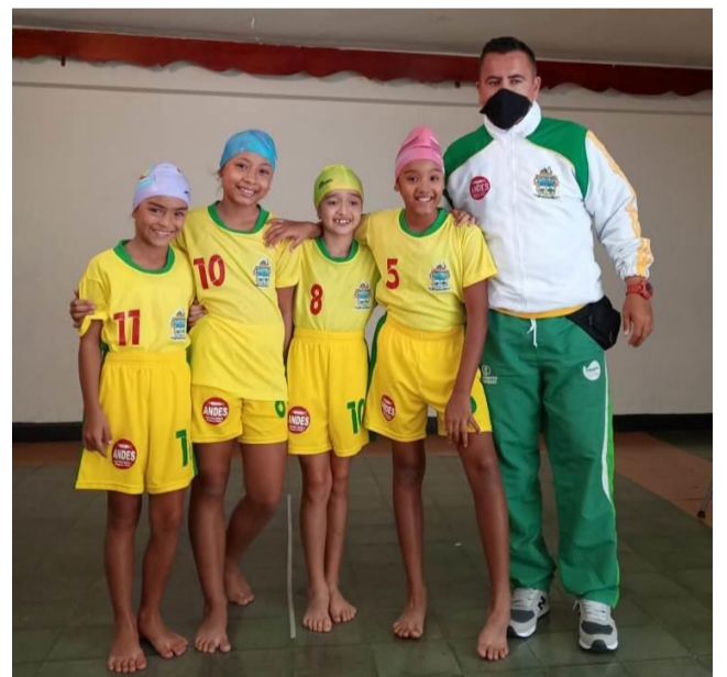
(Foto cortesía de la representación de Andes. Nadadoras virtuales de la delegación de Andes). Abajo: foto cortesía de tenis de mesa de David Gallego.