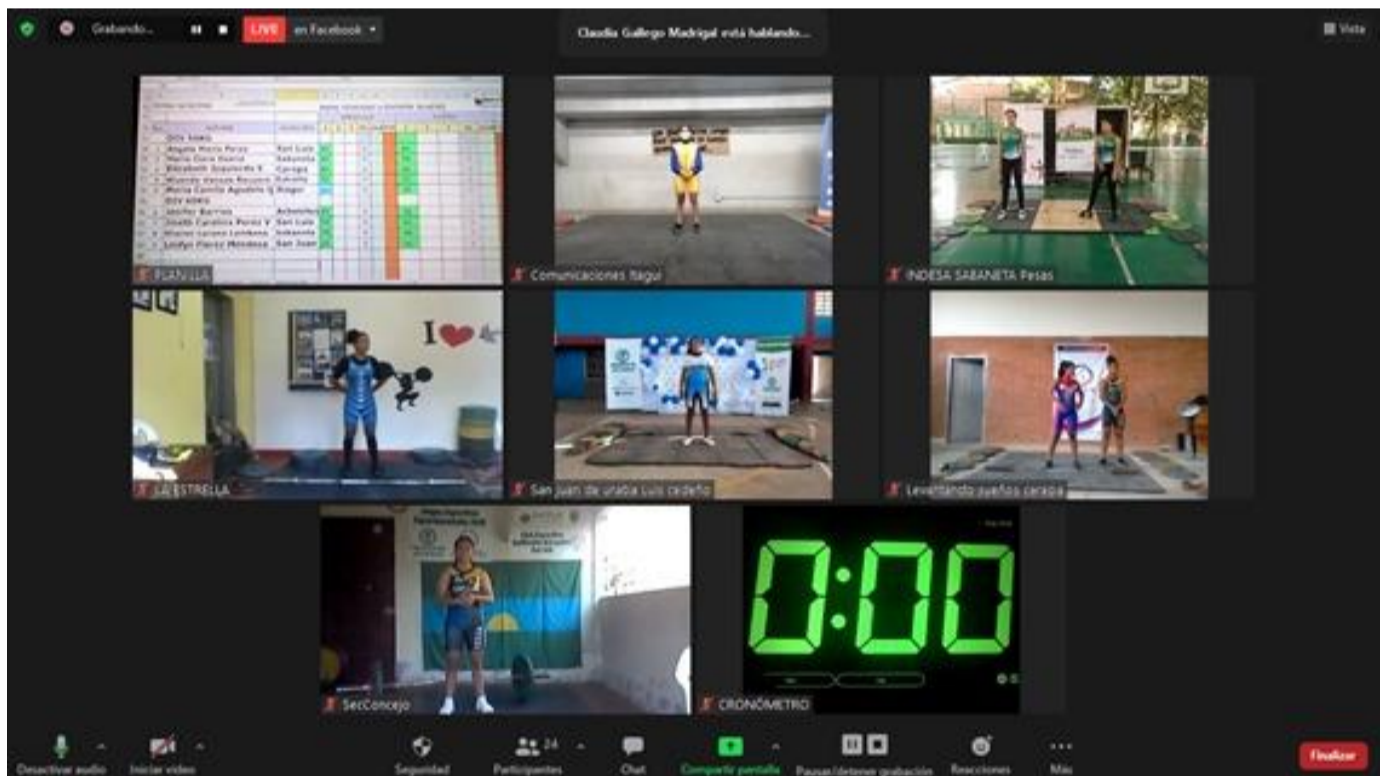
(Competencia de levantamiento de pesas. Imagen cortesía de Claudia Gallego Madrigal)

Fútbol Masculino: Medellín Judo: Medellín Karate Do: Medellín Levantamiento de Pesas: Carepa Lucha: Apartadó Natación Adaptada: Medellín Natación Convencional: Envigado Patinaje: Medellín Rugby Femenino: Marinilla Rugby Masculino: Apartadó Taekwondo: Medellín Tejo: Turbo Tenis de Campo: Rionegro Tenis de Mesa: Envigado Últimate Mixto: Apartadó Voleibol Piso Femenino: Itagüí Voleibol Piso Masculino: Medellín Voleibol Playa Femenino: Envigado Voleibol Playa Masculino: Medellín