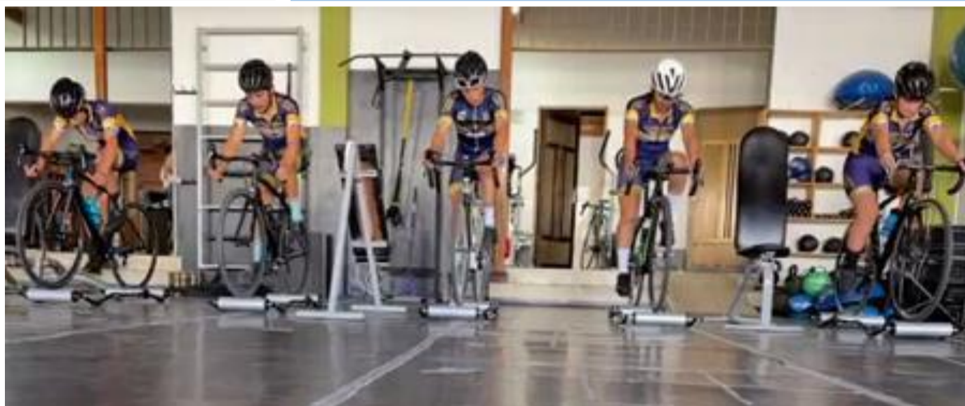
(Ciclistas de El Carmen de Viboral en acción.).

Medellín, Antioquia. (Oficina de Prensa Indeportes Antioquia – Boletín 01-2020). Desde el miércoles 9 de diciembre de 2020, fecha en que se inauguraron, comenzaron las actividades de los Cuadragésimo Terceros Juegos Deportivos Departamentales Virtuales “Indeportes Antioquia 2020”, Final Departamental, certamen deportivo que, en 31 deportes, desarrollará 39 torneos y finalizará el sábado 19 de diciembre del pandémico año.