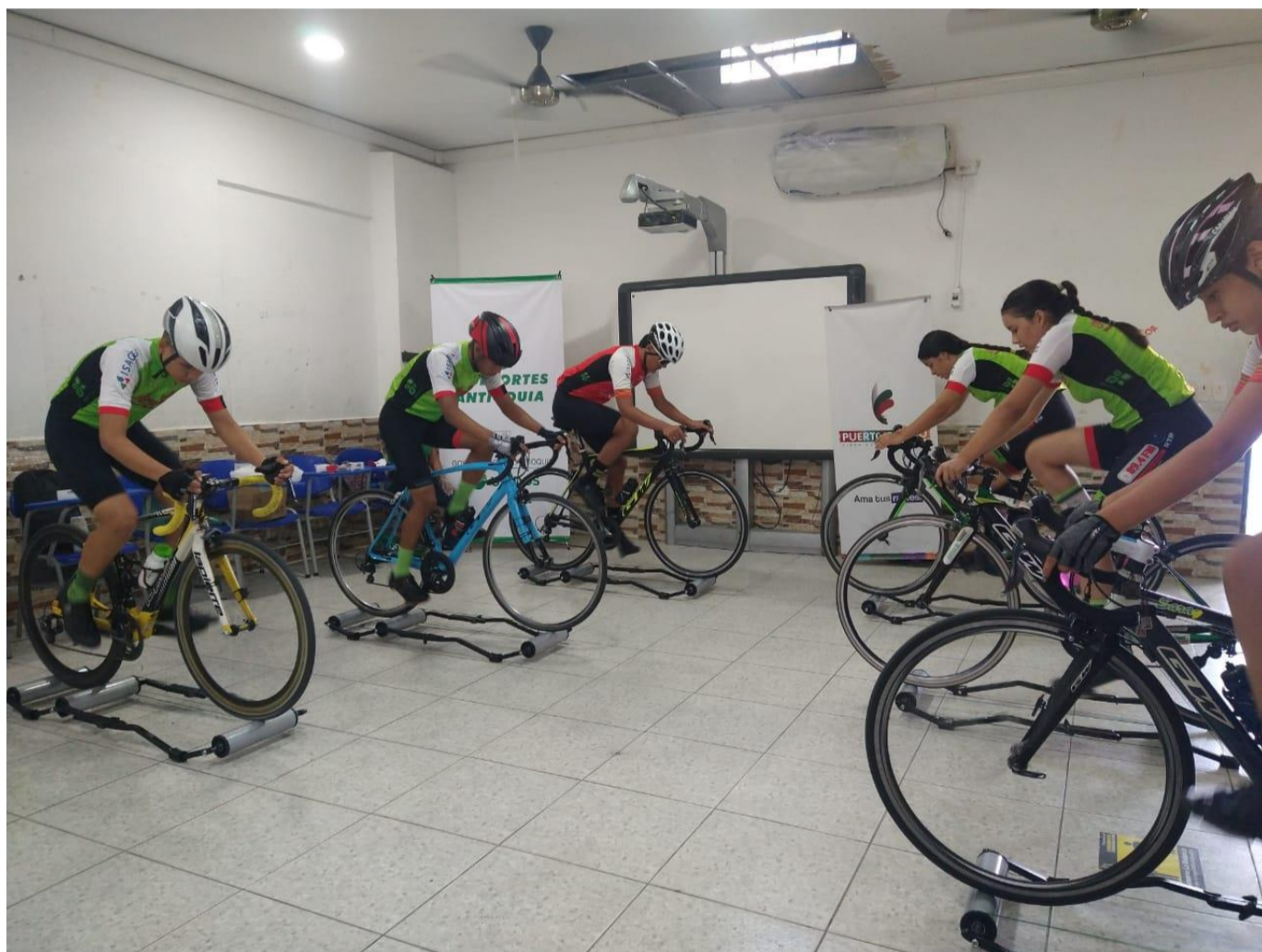
(En la imagen, ciclistas ese municipio en acción)

Chigorodó campeón de levantamiento de pesas. En atletismo convencional el titular fue el municipio de Guarne. La representación de Medellín se adjudicó balonmano en ambas ramas. En fútbol de salón, comenzaron ganando Itagüí, Rionegro y Carepa. Medellin y Envigado mano a mano en tiro con arco. Pto Berrío apareció en ciclismo. Este miércoles la cita es para Salgar. Desde este miércoles competencias de lucha. Congreso técnico de tejo este 16, para primera fecha el jueves 17. En tenis de campo continúan las partidas de hombres y mujeres.