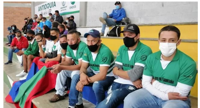
Atletas de San José de la Montaña (Loaizal59)