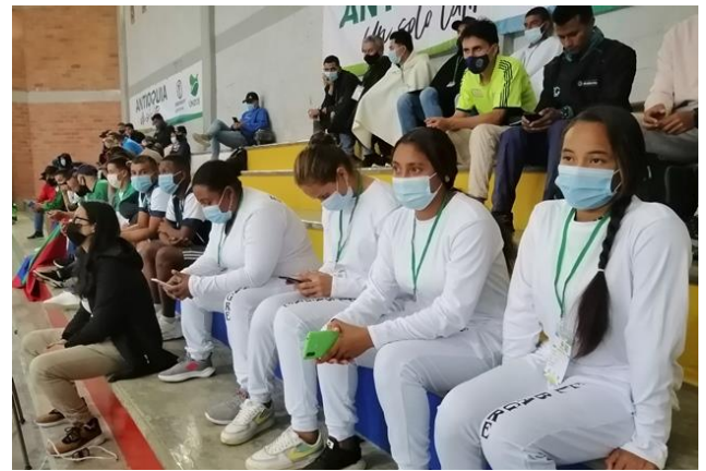
Deportistas de El Bagre (Loaizal59)