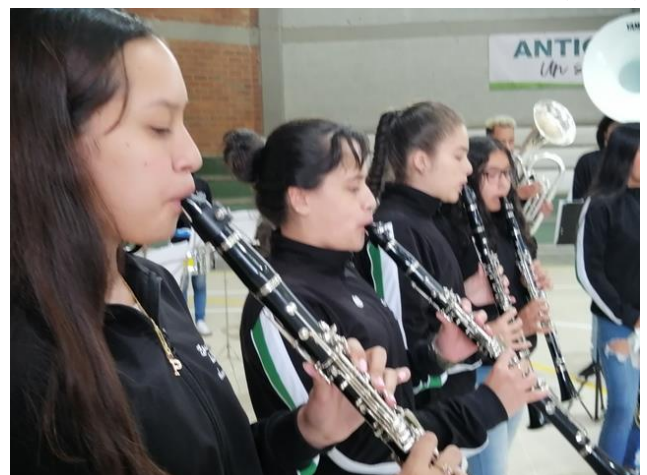
Integrantes de la Banda Musical Noraldo Cañas (Loaizal59)