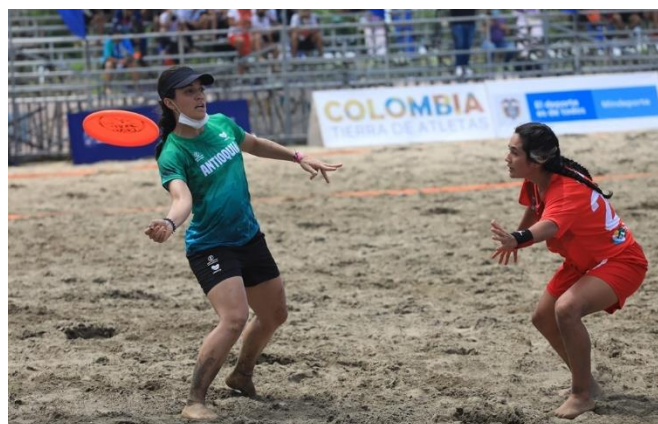
(Antioquia ante Valle del Cauca en ultimate en Tolú)