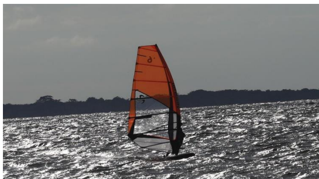
(Vela en el golfo de Morrosquillo)