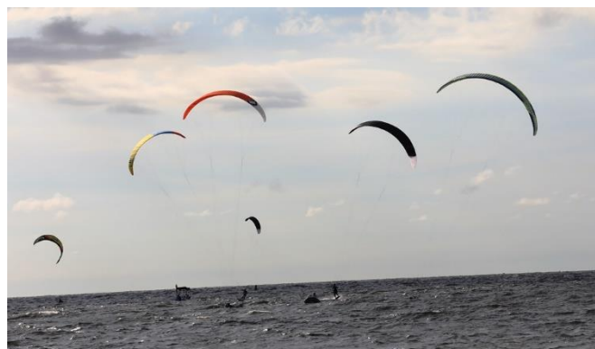
(Competencia de vela: kitesurf)