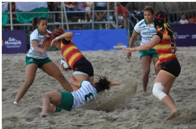
(Rugby: Antioquia vs. Bogotá)