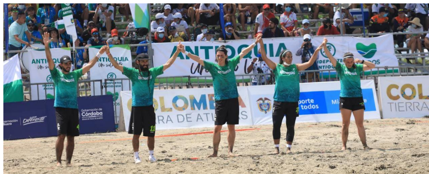
(Algunos integrantes de la selección Antioquia de ultimate mixto)