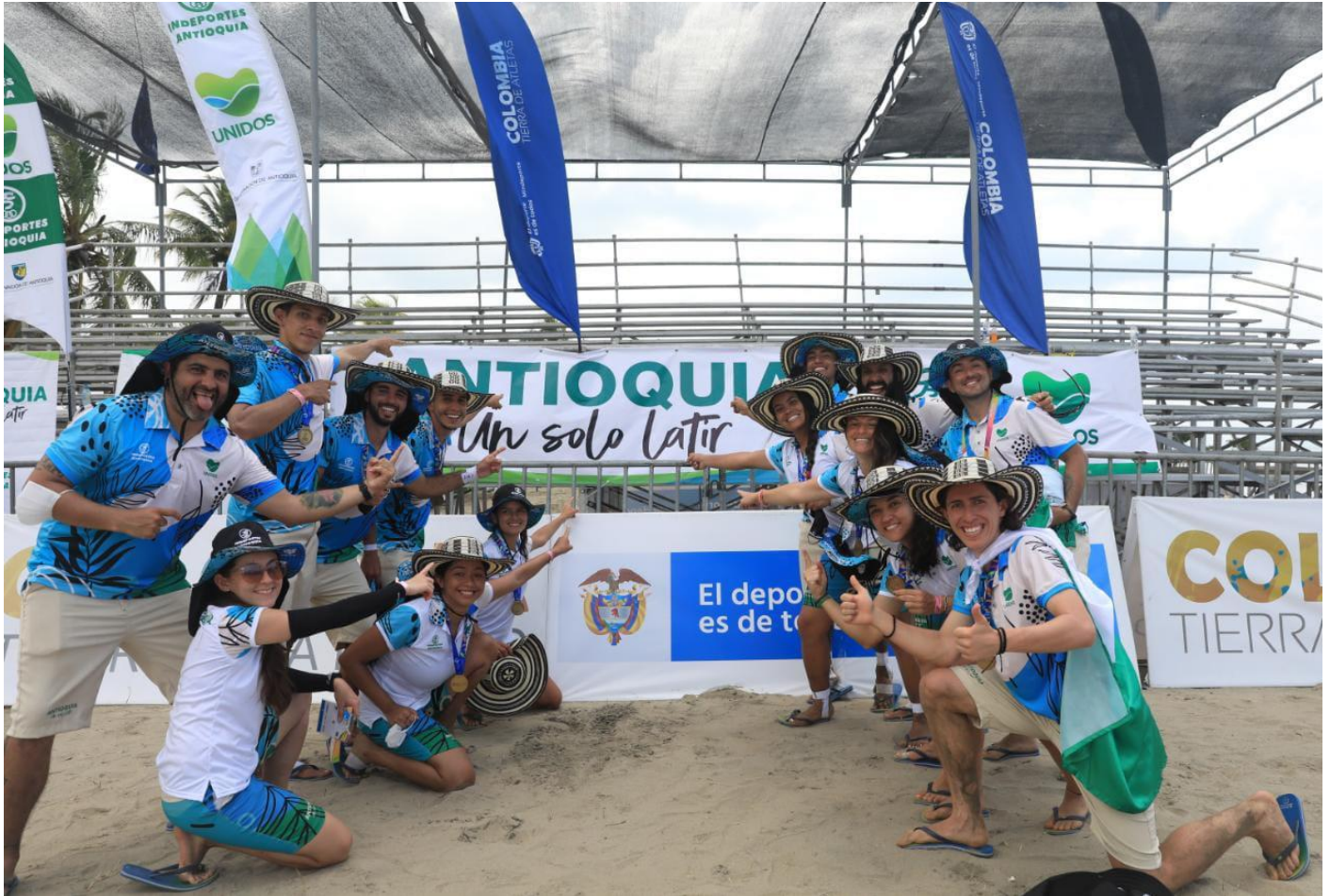
(Arriba, integrantes de la selección Antioquia de ultimate, equipo ganador de la medalla de oro en los Juegos de Mar y Playa, en Tolú. A la izquierda, el éxtasis que da el triunfo deportivo.)

Entran a escena, los deportistas de triatlón.