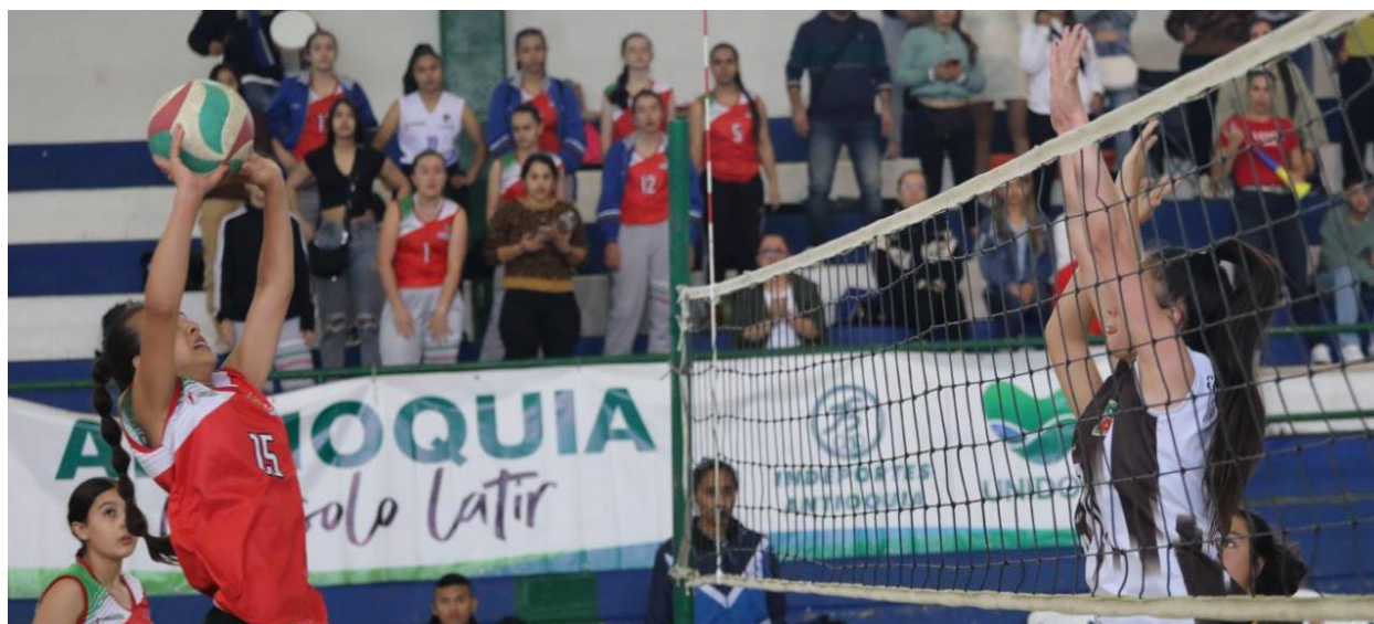
En la imagen: final prejuvenil de voleibol entre El Santuario y Carmen de Viboral.

El oriente antioqueño ya tiene representantes clasificados a los 42° Juegos Interscholasticos de la fase departamental, se trata de los ganadores de las justas realizadas en esta subregión del departamento, entre el 10 y el 14 de agosto; en las cuales los municipios de La Ceja, El Retiro y Guarne, se convirtieron en las sedes principales para que cerca de 1640 jóvenes, de 23 municipios, se disputaran los primeros lugares de: baloncesto, balonmano, fútbol de salón, fútbol sala, fútbol, voleibol, ajedrez, atletismo, tenis de mesa, bicicross y patinaje.