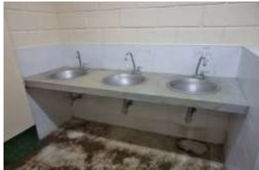
Lavamanos Fuera de Servicio por fugas

El acta de recibo final de la obra, se suscribió el día siete (7) de diciembre de 2015, sin embargo, en la visita realizada por la CGA se encontró en condiciones de descuido las instalaciones del escenario deportivo, como se evidencia en las siguientes imágenes: