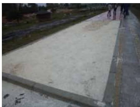
Gimnasio al aire libre y arena de saltos

Por encontrarse el contrato sin liquidar, deberá ser objeto de revisión en la siguiente vigencia.