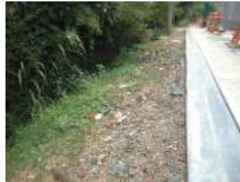
Talud en riesgo de erosión

Por encontrarse el convenio sin liquidar, deberá ser objeto de revisión en la siguiente vigencia.