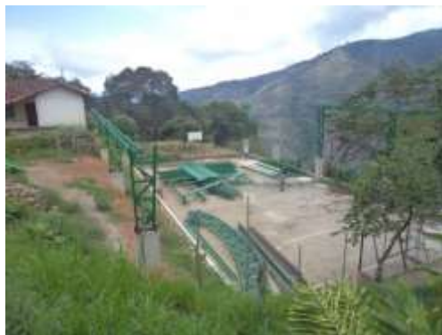
Proyecto: Construcción de la cubierta en la placa polideportiva de la vereda rojas en el corregimiento de guayabal sin ejecutar.

El contrato de obra No. 060 de 2015 se encuentra suspendido desde el día 18 de diciembre de 2015, fecha que de acuerdo a los documentos reportados en Gestión Transparente y en el expediente del convenio que reposa en Indeportes venció el plazo de ejecución del contrato, sin que se demuestre otra actuación mediante la cual se haya ampliado el plazo de ejecución así como la ampliación de la Garantía única del contrato. Además la suspensión se sustenta por el traslado de la red de energía eléctrica que atraviesa la placa polideportiva de la vereda Rojas del corregimiento Guayabal. Hecho que evidencia falta de gestión administrativa que propenda al buen desarrollo y ejecución del contrato, ya que en la visita realizada se evidenció que la obra en éste corregimiento se encuentra inconclusa y con la estructura metálica para la cubierta a la intemperie, hecho que pone en riesgo los recursos ya pagados al contratista por las actividades de cimentación de la cubierta y la inversión en la compra de la estructura metálica de ésta.