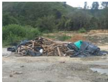
Acceso con aguas lluvias represadas y escombros provenientes de la construcción en el municipio de Yolombó

En el análisis del A.U. se estimaron costos para cerramientos provisionales, actividad que ya se encuentra pagada dentro de los costos directos del proyecto, hecho que constituye un presunto detrimento patrimonial, conforme