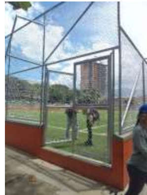
Cancha sintética, cerramiento y andenes

Por encontrarse el convenio y contrato sin liquidar, deberá ser objeto de revisión en la siguiente vigencia.