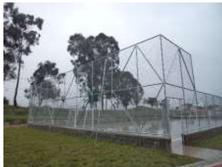
Pista atlética y placa polideportiva