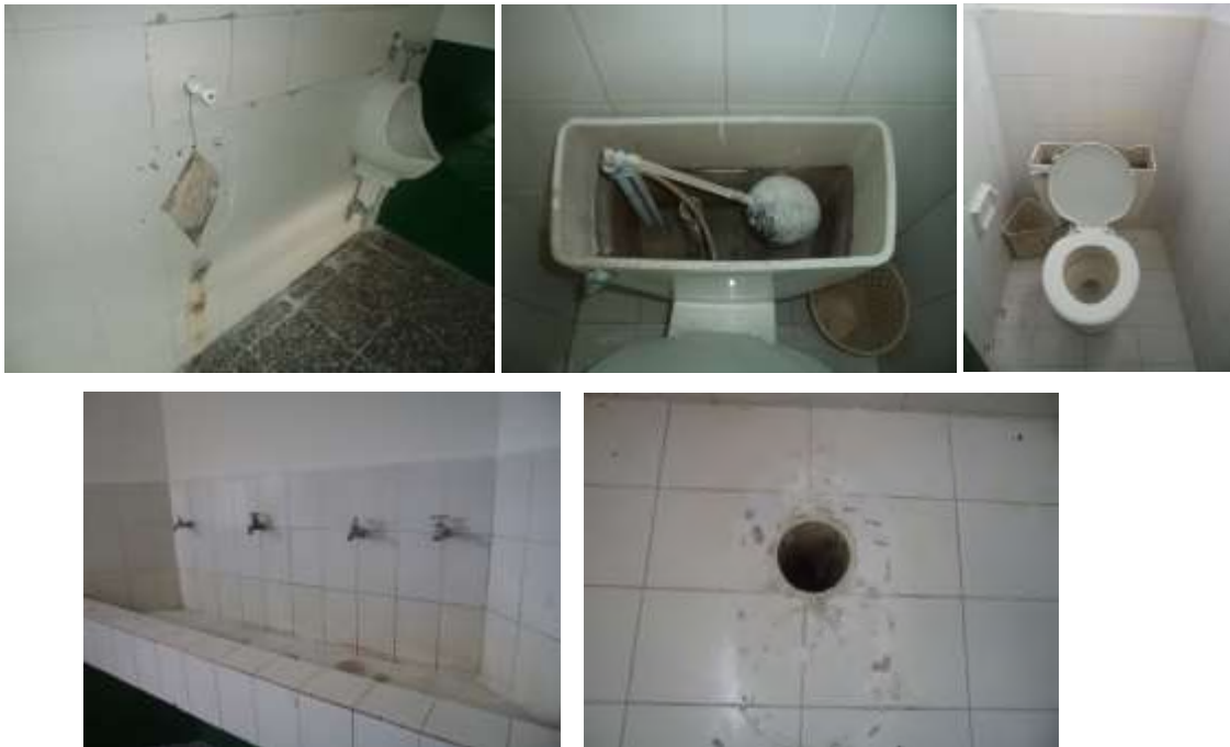
Estado actual de las unidades sanitarias