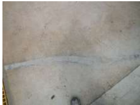
Fractura de andén en la entrada al escenario y fisuras presentadas en andenes perimetrales en el escenario de Entrerriós