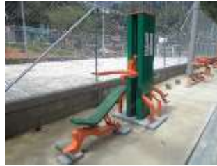
Gimnasio al aire libre