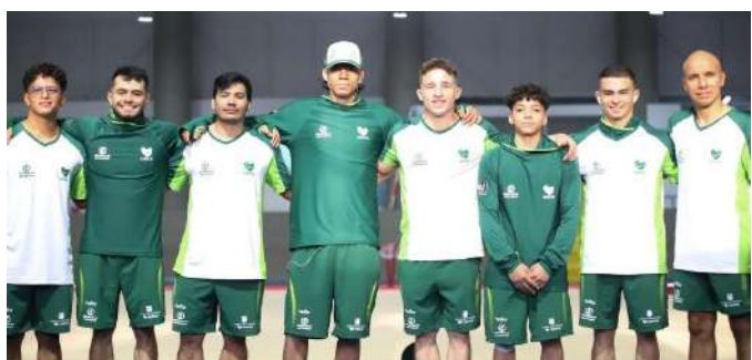
(Gimnastas de Antioquia en la ciudad de Armenia)

Hapkido: Valle del Cauca Natación Artística: Valle del Cauca Patinaje Artístico: Valle del Cauca Porrismo (exhibición): Bogotá Voleibol Playa femenino: Santander Voleibol Playa masculino: Antioquia