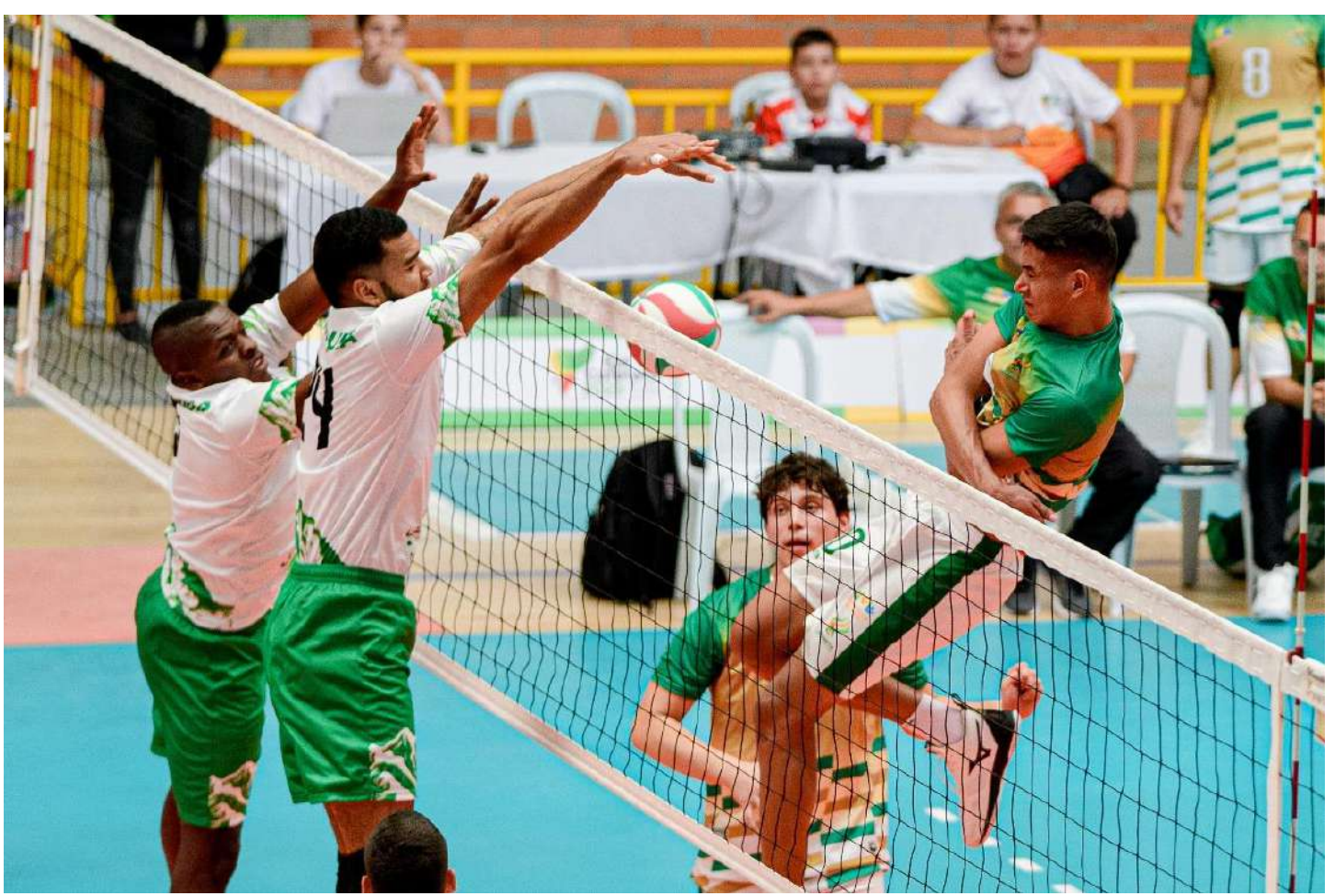
(Voleibol piso. Antioquia 3 – Meta 0. Foto de Juan Sebastián Hernández de Indeportes Antioquia)