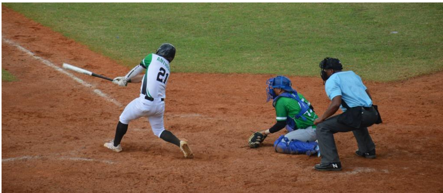
(El béisbol caliente los ánimos en la Sultana del Valle del Cauca. En la foto de Marco Antonio Garcés Quintero, Antioquia vs Córdoba).

Los Juegos avanzan en su primera semana y el Urabá antioqueño levanta la mano para ser la sede de la edición 2027.