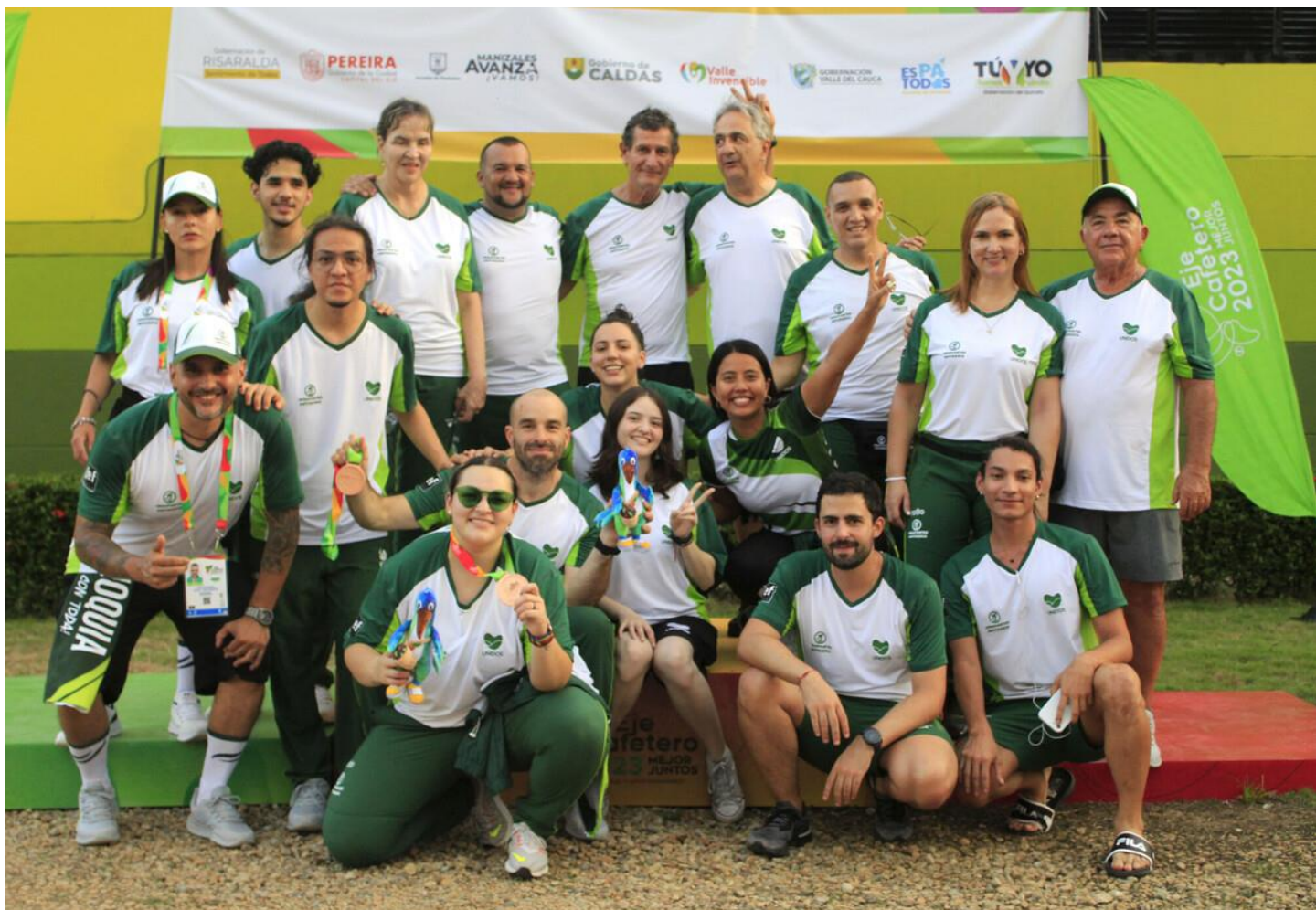
(Tiro Deportivo en Nilo, Cundinamarca. )