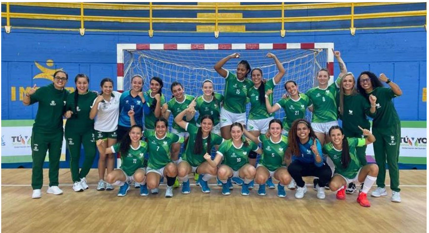
(Arriba equipo de balonmano de Antioquia, campeón de los Juegos Nacionales en Armenia. Abajo a la derecha, deportista integrante de la selección Antioquia de squash.)

Este jueves 16 de noviembre, en la sexta, 51 medallas de oro en disputa.