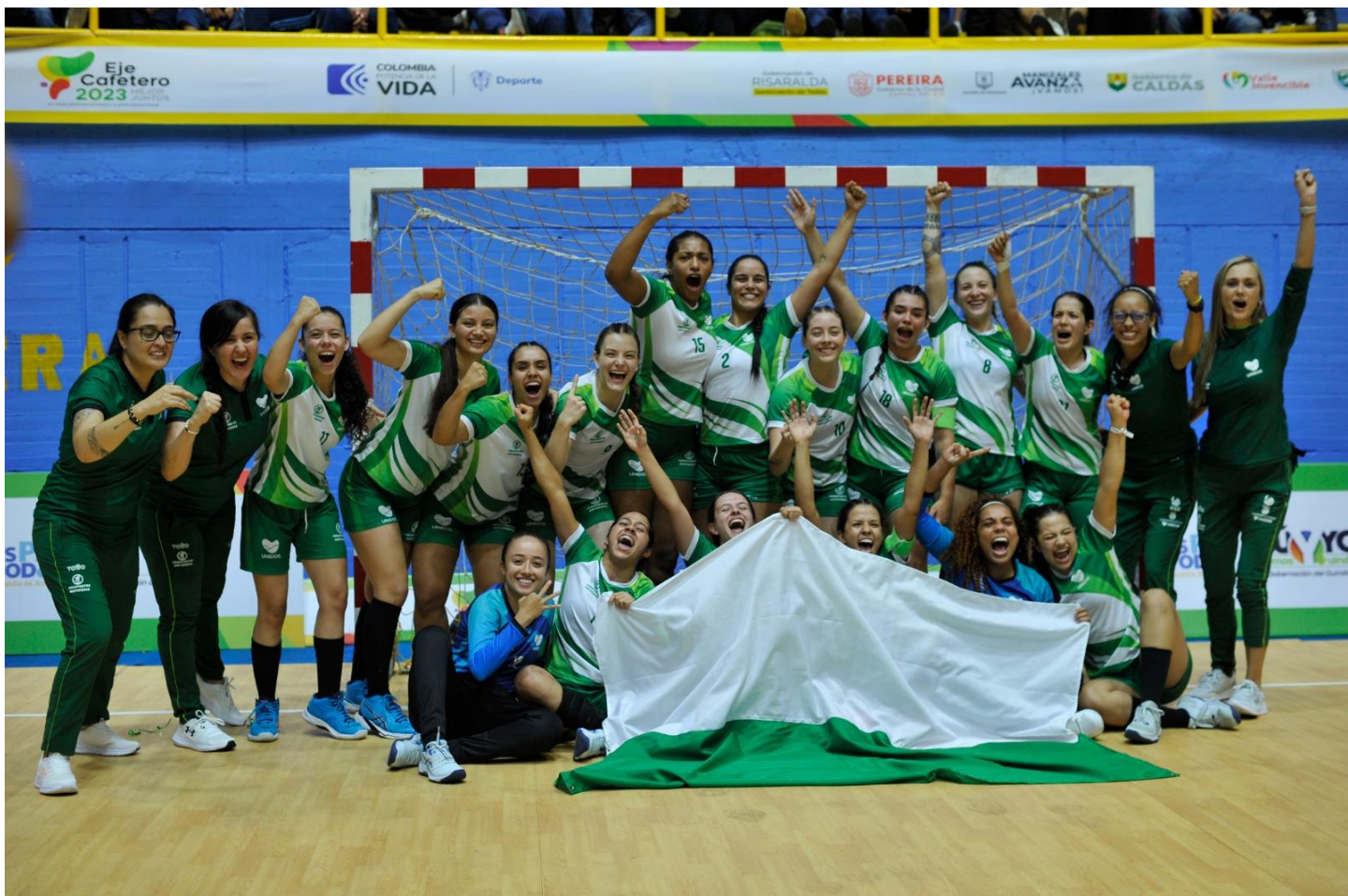
(Balonmano femenino de Antioquia – campeón nacional).

12:00 a 1:00 p.m. lanzamiento final. Cada dos minutos y últimos 5, cada 3 minutos.