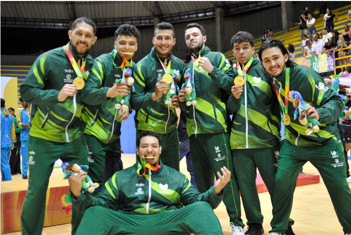
Balonmano masculino de Antioquia fue el campeón al vencer a Quindío en la final 29 – 23).

Los 39 torneos que han terminado se los han adjudicado Valle del Cauca (13), Antioquia (11), Bogotá (7), Bolívar (3). Con uno están Cundinamarca, Boyacá, Caldas, Norte de Santander y Santander.