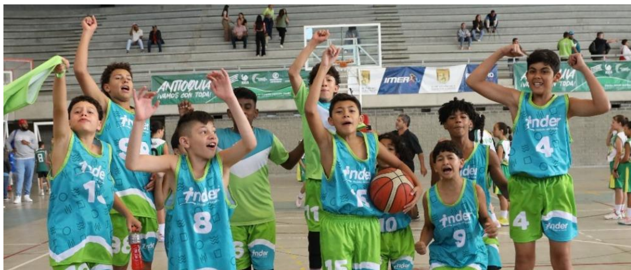
Los medellinenses también lograron el título en el baloncesto masculino en los Juegos Deportivos Escolares 2023.