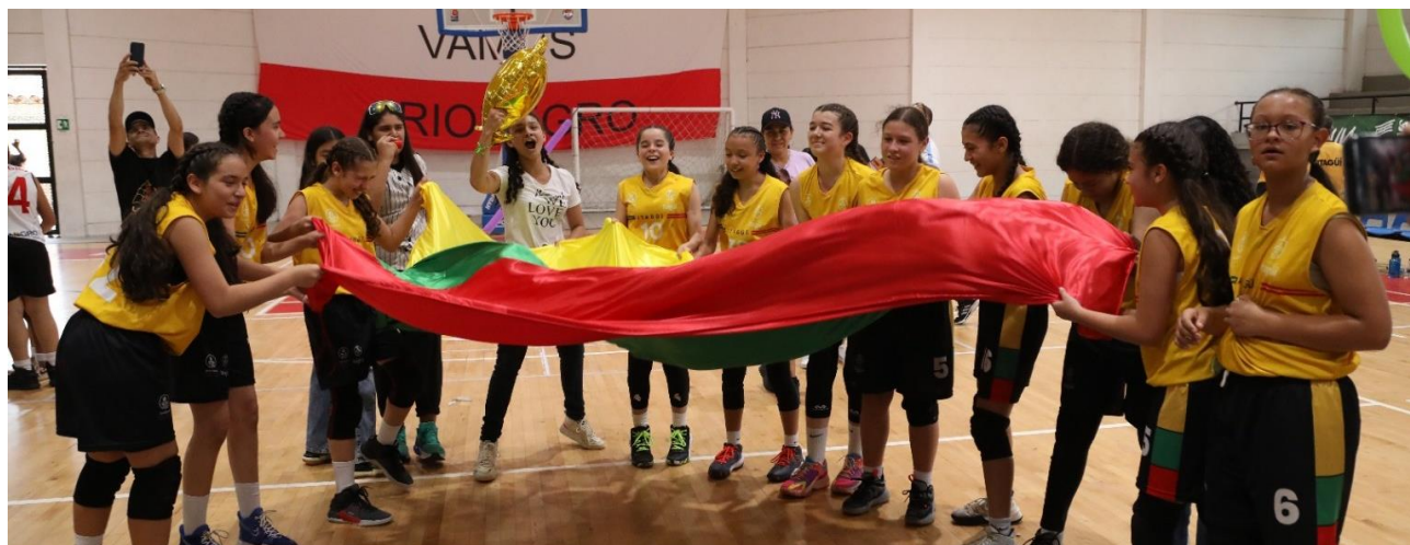
Las niñas de Itagüí celebran el título departamental en baloncesto alcanzado en los Juegos Deportivos Escolares 2023.

*Por tratarse de un festival de exhibición, las medallas de actividades subacuáticas no sumaron al cuadro general.