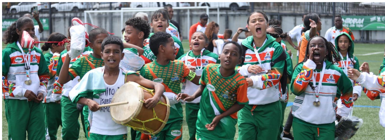
Tanto las mujeres como los hombres de Apartadó alcanzaron el título en fútbol y, con alegría y mucho entusiasmo, dieron la vuelta olímpica en la cancha Santander, de Rionegro.

Durante los seis días de actividades en Rionegro, se vivió una emocionante fiesta en la que deportistas, padres de familia, profesores, entrenadores, árbitros y aficionados se congregaron en los diferentes escenarios deportivos para disfrutar de las competencias infantiles.