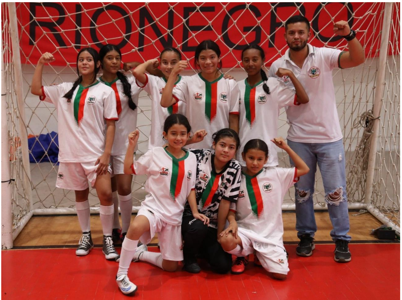
Las mujeres del municipio de Peque son poderosas. Fueron las mejores en el fútbol de salón de los Juegos Deportivos Escolares en Rionegro. Derrotaron en la final 4-1 a su similar de Turbo.

Indeportes Antioquia, UNIDOS, con la Alcaldía de Rionegro, a través del Instituto Municipal de Educación Física, Deporte y Recreación (IMER), felicitan a todos los participantes de estas justas atléticas: deportistas, entrenadores, delegados, dirigentes, árbitros, periodistas, servidores públicos y la comunidad en general.