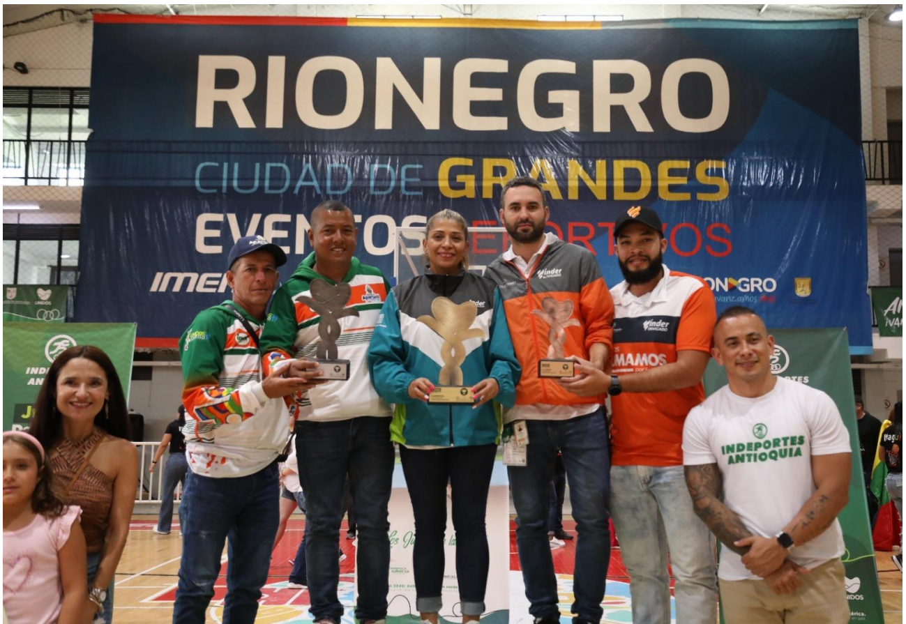
En la imagen, los delegados de Medellín, Apartadó y Envigado recibiendo los reconocimientos en el podio, que los acredita como las mejores delegaciones en los Juegos Deportivos Escolares 2023, en Rionegro. Fueron primero, segundo y tercero, respectivamente, en la tabla general de medallería.

Indeportes Antioquia, UNIDOS, con la Alcaldía de Rionegro, a través del Instituto Municipal de Educación Física, Deporte y Recreación (IMER), felicitan a todos los participantes de estas justas atléticas: deportistas, entrenadores, delegados, dirigentes, árbitros, periodistas, servidores públicos y la comunidad en general.