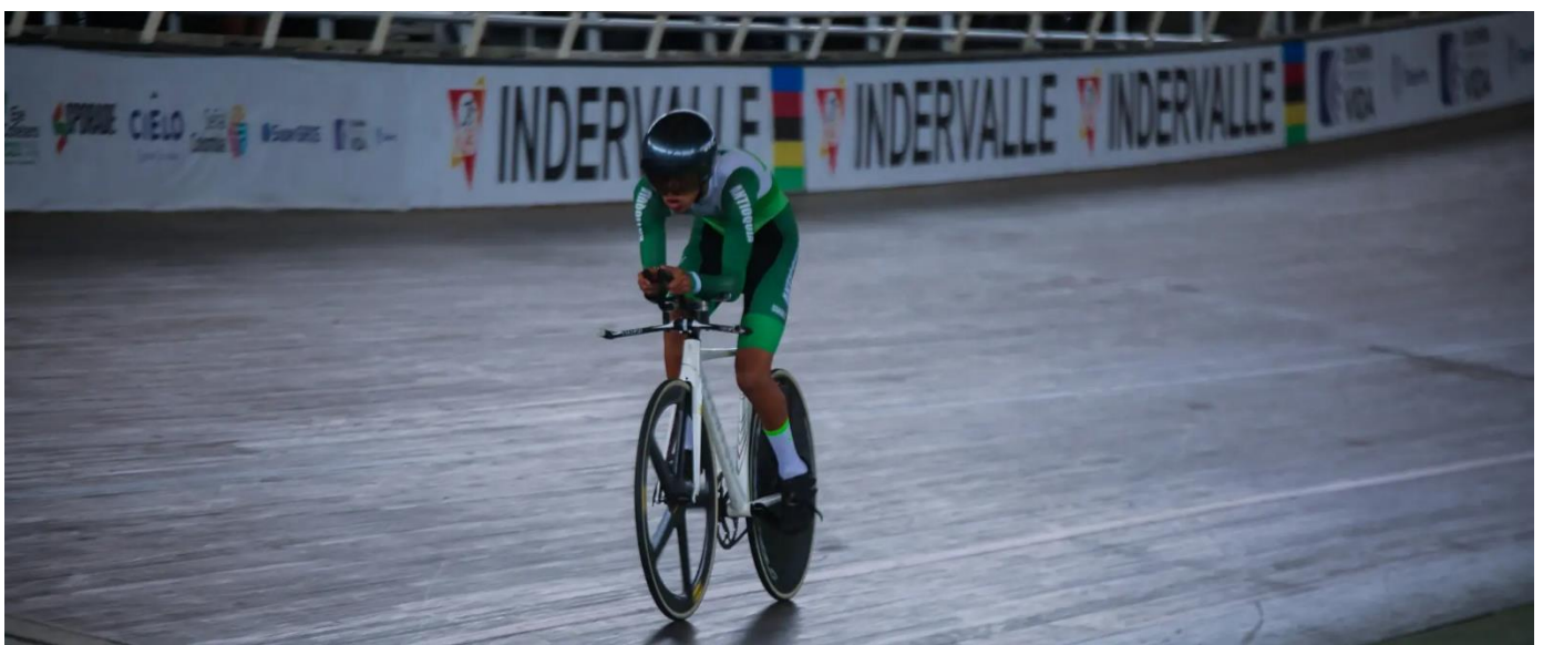
(Foto de paracycling en la Sultana del Valle del Cauca.).