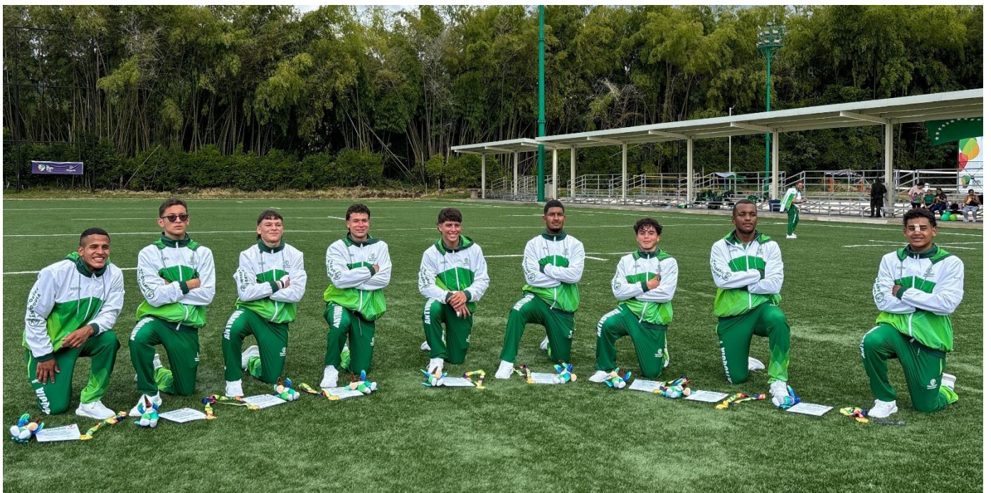
(Equipo antioqueño de rugby siete, campeón nacional juvenil.)