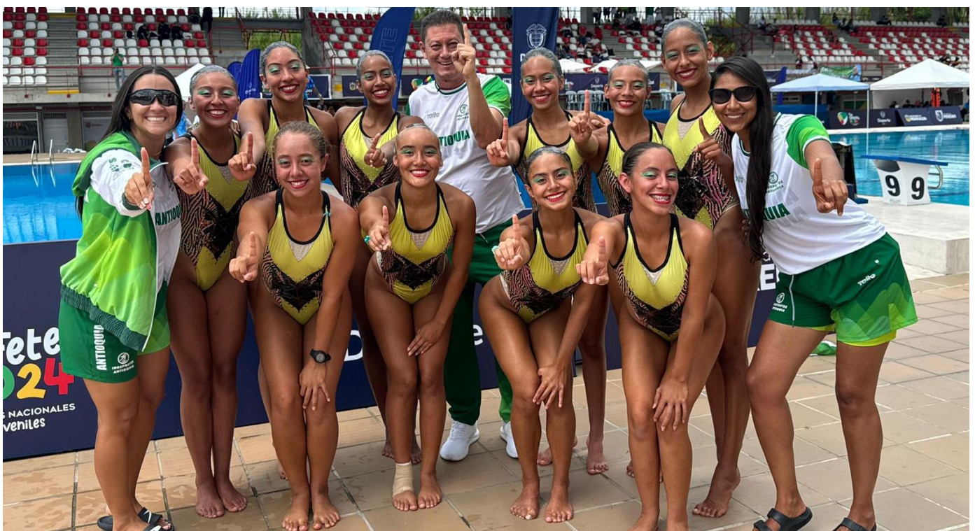
(Equipo de rutina libre en femenino, natación. Foto de la Liga de Natación de Antioquia por intermedio de Fredy Alexander Pulgarín Serna)