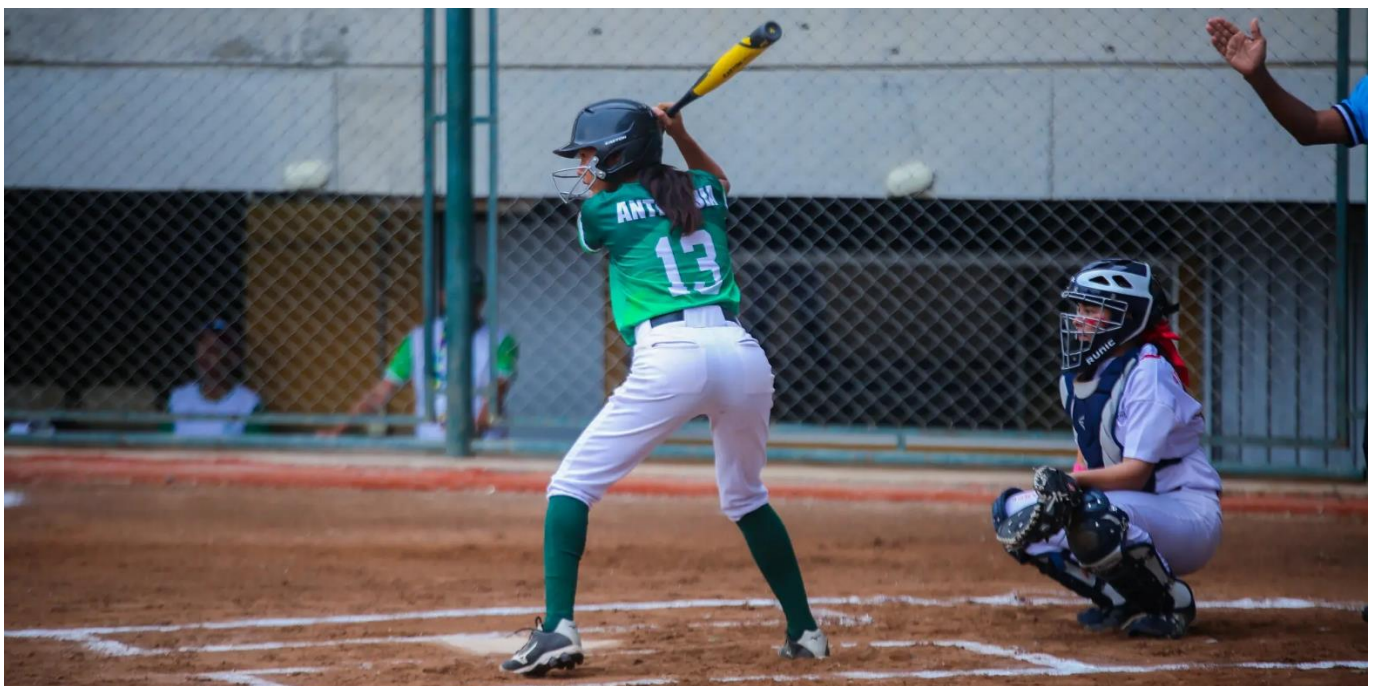
(Imagen tomada de la página web de los Juegos Nacionales Juveniles ).