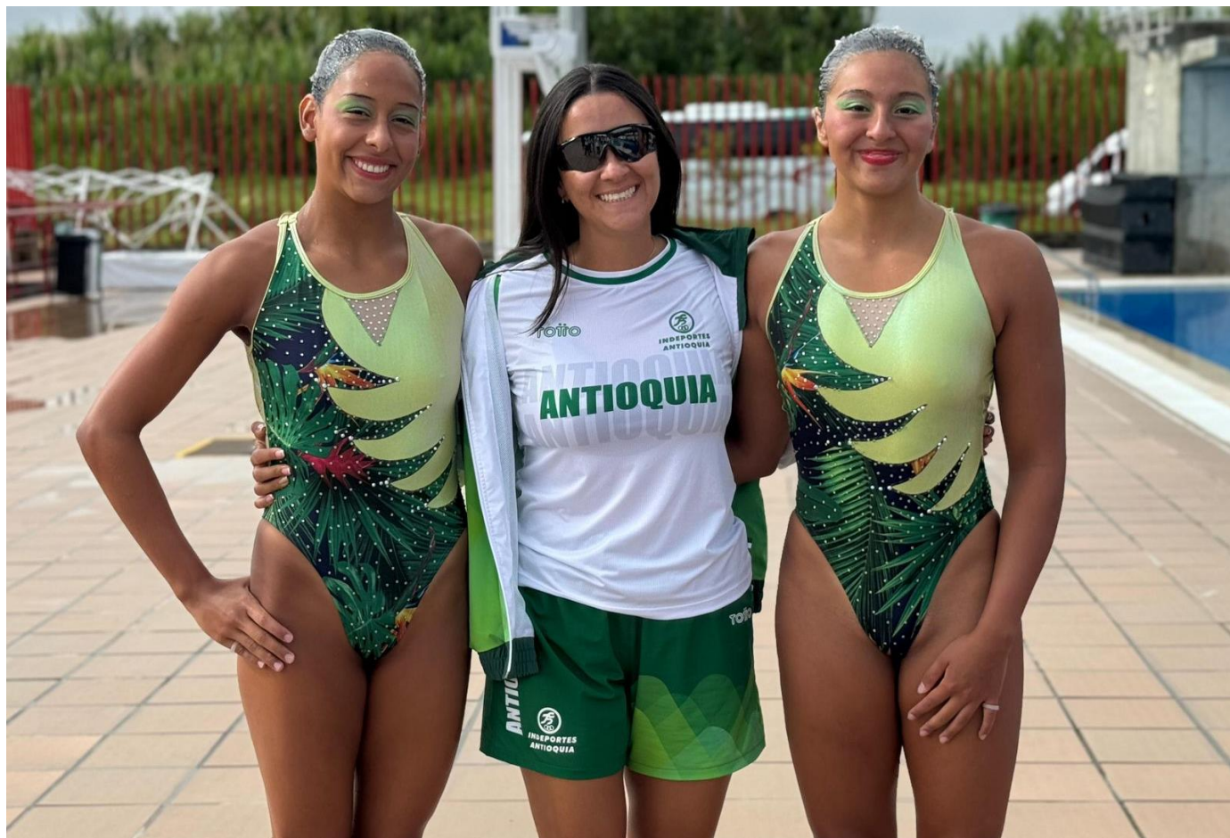
(Arriba, integrantes del dueto de rutina libre en femenino, nado sincronizado con su entrenadora. Abajo a la derecha, escena de gimnasia rítmica en Armenia. ).

Primeros Juegos Nacionales Juveniles del sector olímpico y paralímpico. Rugby siete masculino fue para la delegación de Antioquia. Natación artística y ciclismo de pista entregaron cuatro oros a los antioqueños. Antioquia suma ocho títulos en las justas nacionales, los mismos que tiene Bogotá. Valle del Cauca ha ganado seis torneos. Atlántico (2), Caldas, Casanare y Santander han logrado los otros cinco campeonatos.