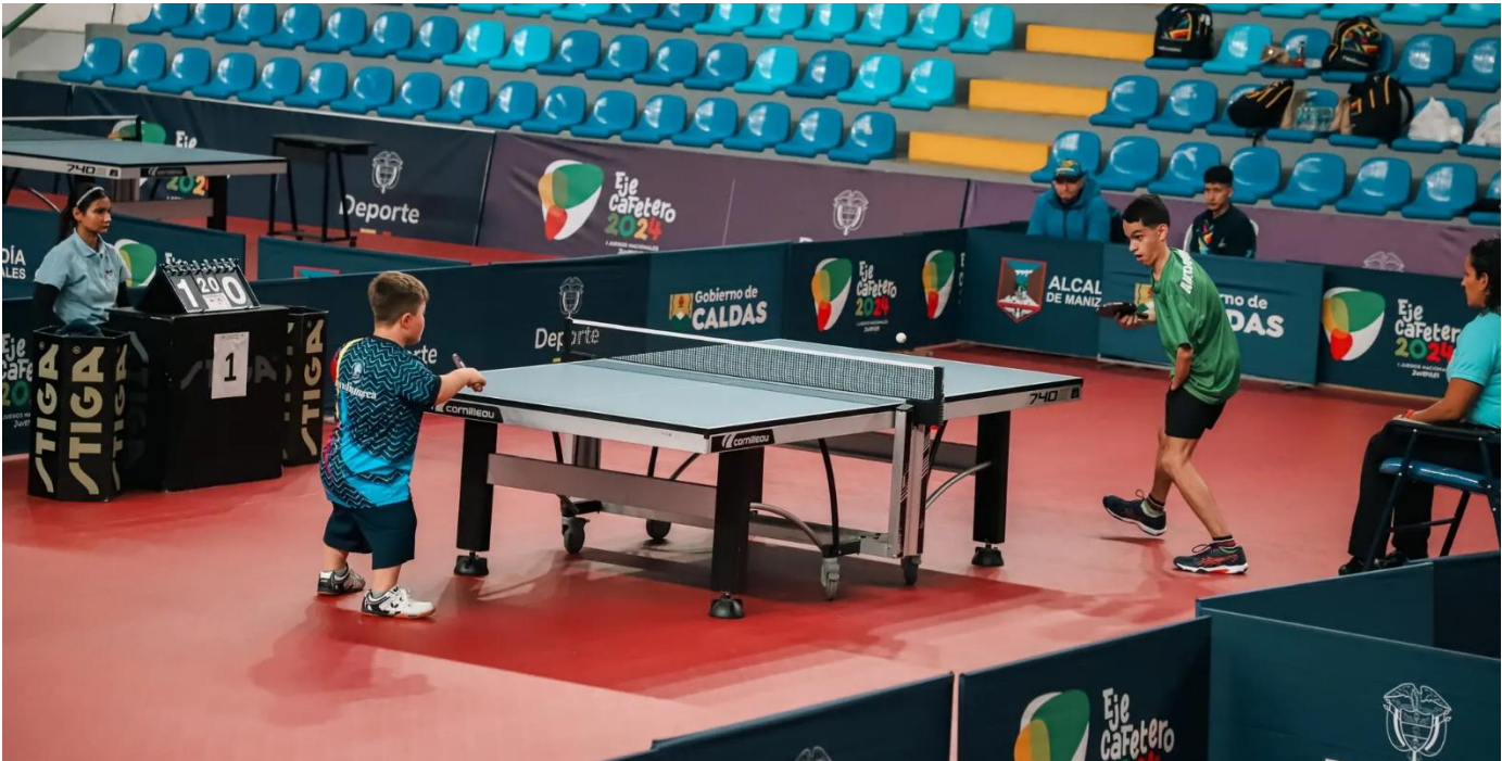
(Para tenis de mesa.).