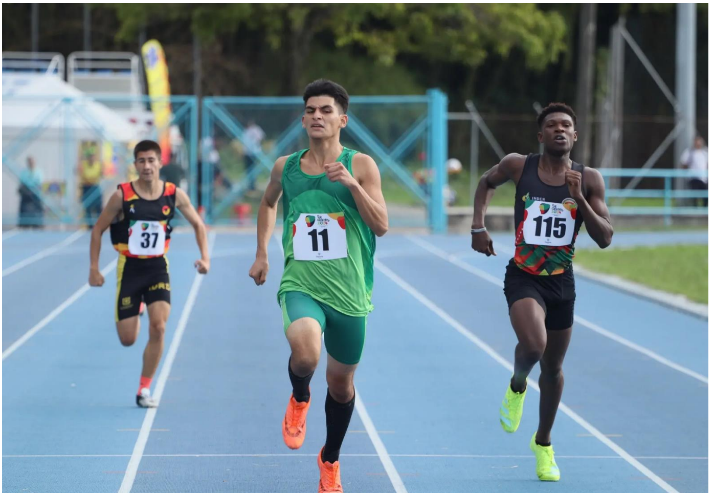
(Paratletismo en Armenia, en el marco de los Juegos Paranacionales Juveniles. ).