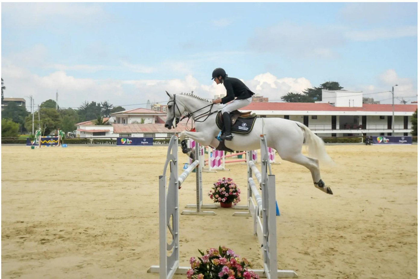
(Foto tomada de la página web de los Juegos Nacionales Juveniles ).