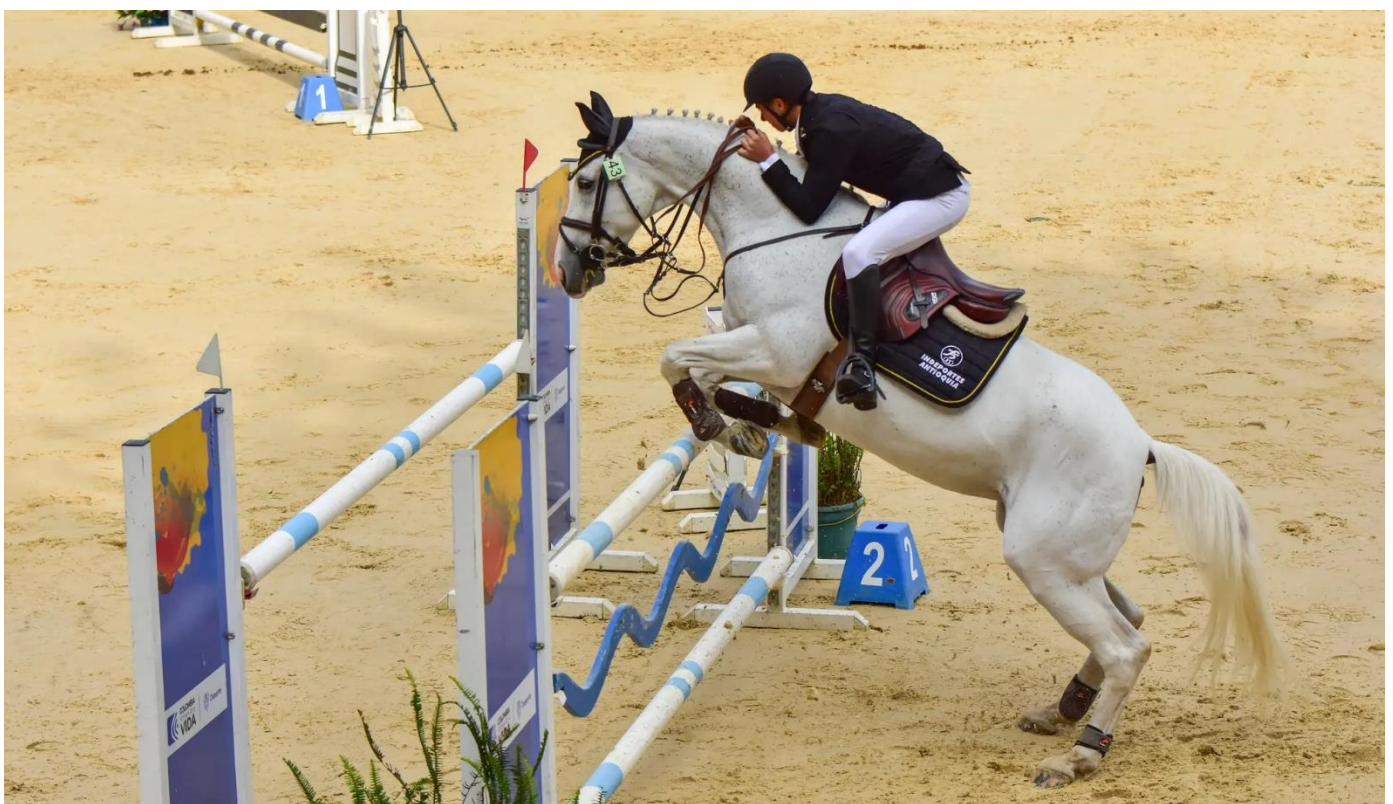
(Competencia de Antioquia en ecuestre en la ciudad de Bogotá.).