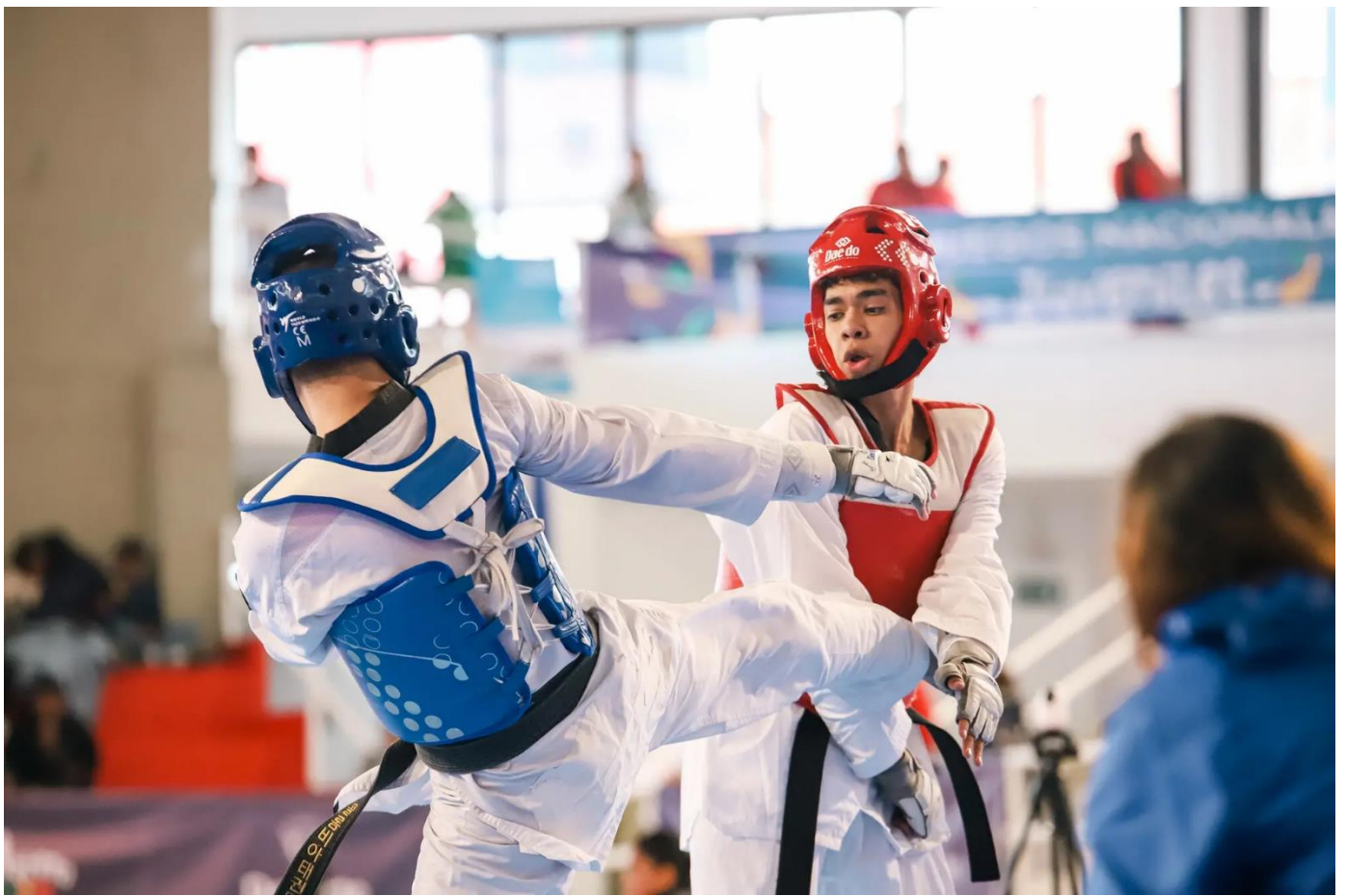
(En taekwondo, el equipo campeón fue Boyacá. Los boyacenses sumaron 13 medallas de 23 posibles. Antioquia consiguió una plata y tres bronce en este deporte. ).