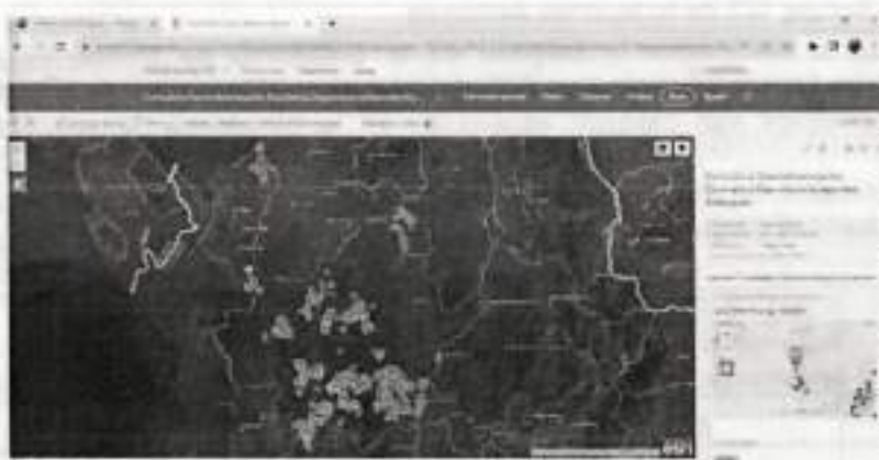
Visualización Escenarios Cargados por los Municipios