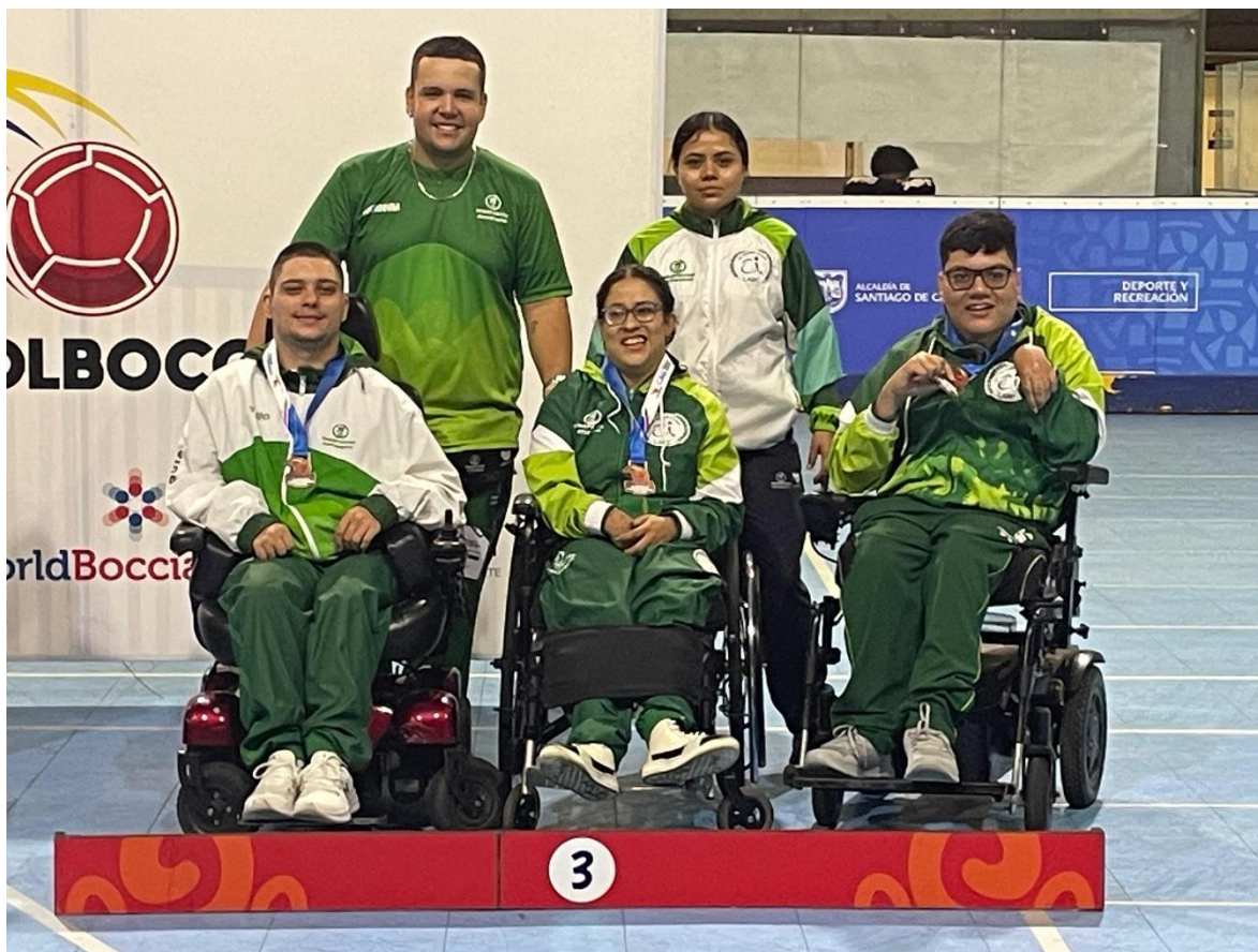
Medalla de bronce de la selección Antioquia de Boccia - Categorías BC1 y BC2 por equipos

Para finalizar: mientras corrían los primeros días del Campeonato Nacional de Ciclismo Pista, terminaba el Campeonato Nacional de Boccia que se realizó también en Cali hasta el 3 de octubre en el Coliseo de Hockey Miguel Calero de Cali.