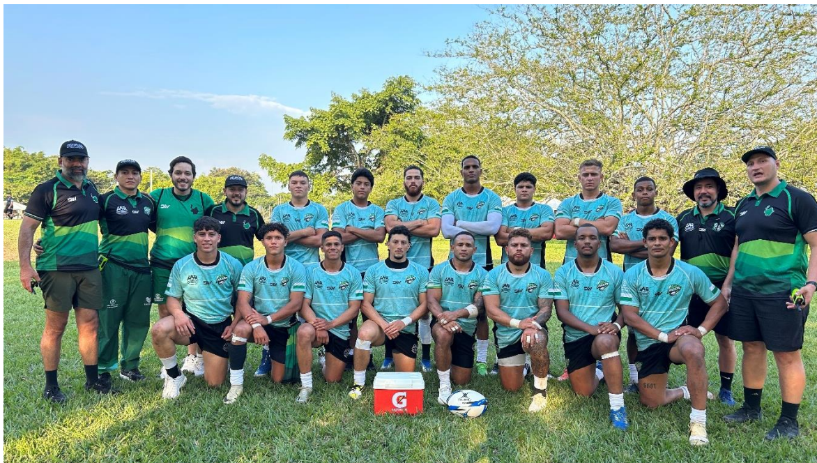
Selección masculina de Rugby 7

Inició este sábado, en el Centro Campestre Comfandi Pance, el Campeonato Nacional Interligas de Rugby 7. Treinta atletas y un equipo técnico interdisciplinario integran la delegación antioqueña que participa de este campeonato nacional Interligas de Rugby, que se realiza también en Cali, Valle del Cauca.