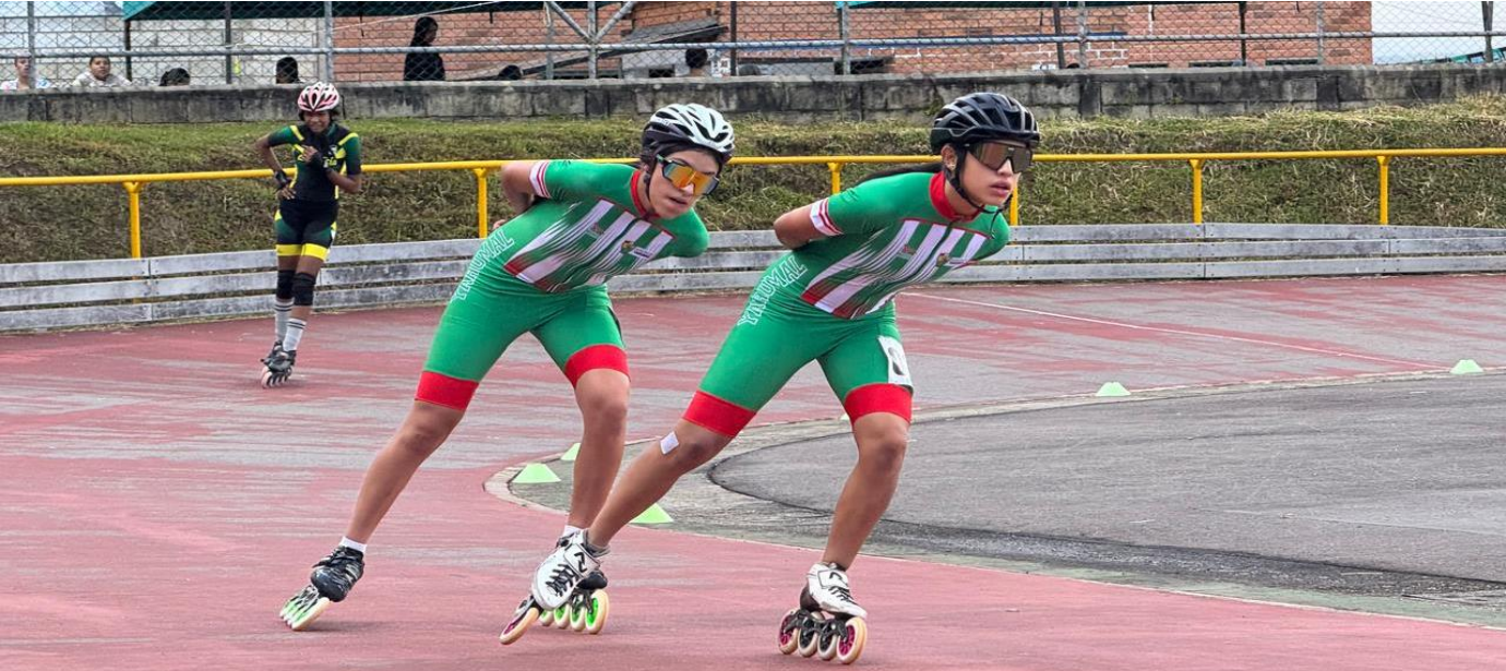
(Otro deporte que termina este viernes 1 de agosto es patinaje. El forcejeo está muy pareja. Nechí, Yarumal, Santa Rosa de Osos, Caucasia y San Pedro de los Milagros buscan la supremacía.)