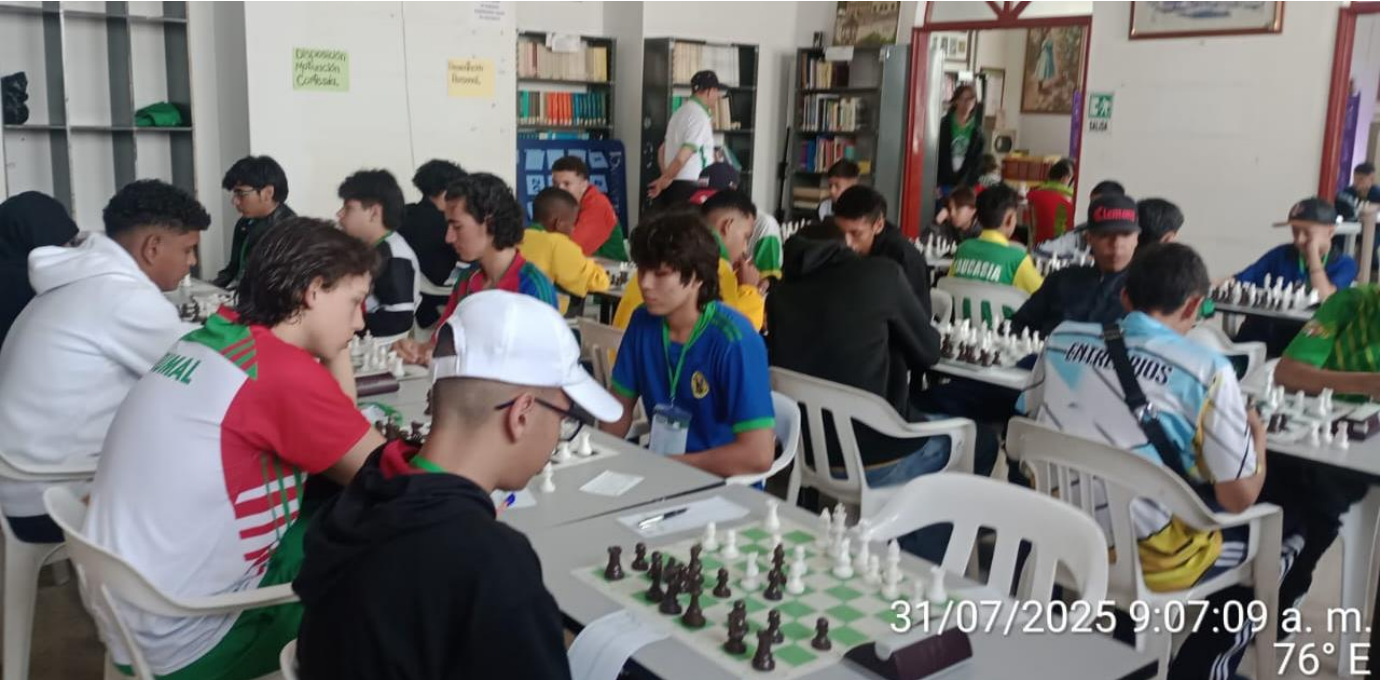
(La disputa en ajedrez, es bastante pareja. Este viernes 1 de agosto se conocerán los campeones.).