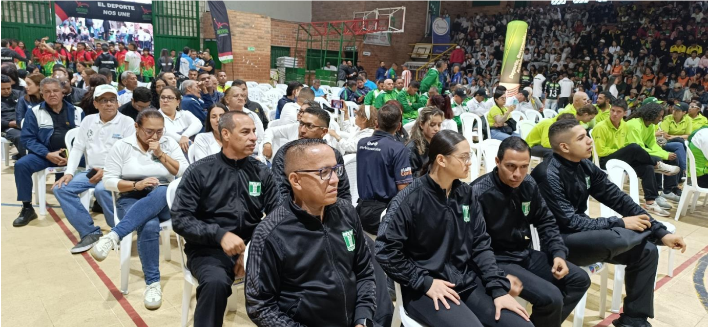
(Autoridades de juzgamiento en la inauguración de los Juegos Intercolegiados de Norte y Bajo Cuca en Yarumal.)