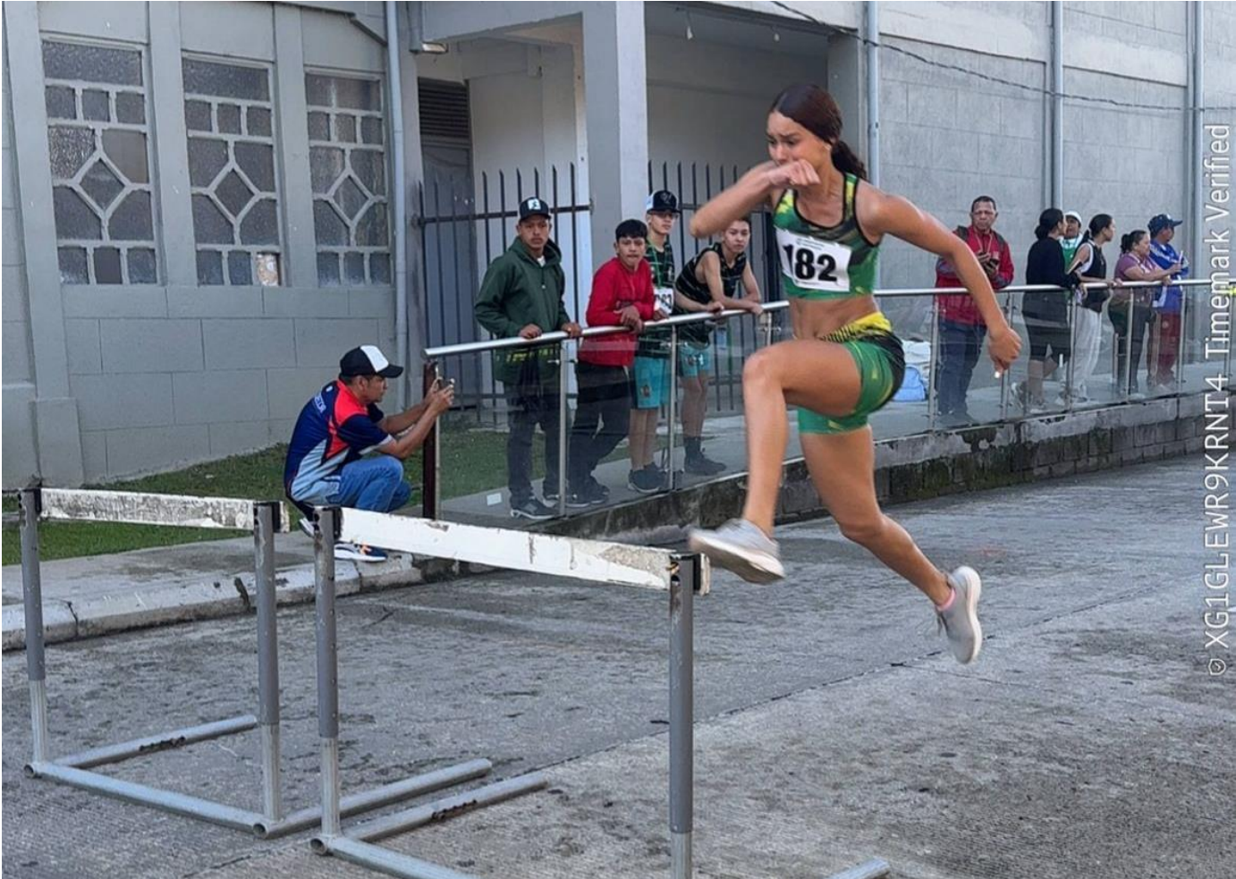
(Escena del deporte base en una imagen).