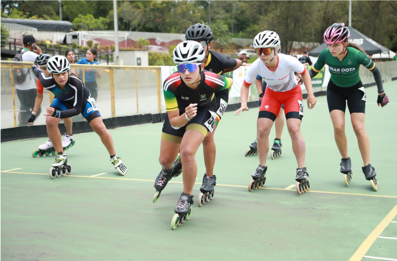
(En el torneo de patinaje, a los patinadores de Medellín les siguen Rionegro, Guarne, Envigado y Yarumal.).

Prueba 70 – 4x100 metros, relevo libre, prejuvenil varones.