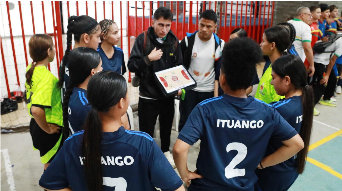
(Las deportistas de futbol de salón de Ituango atentas a las directivas de su entrenador.).