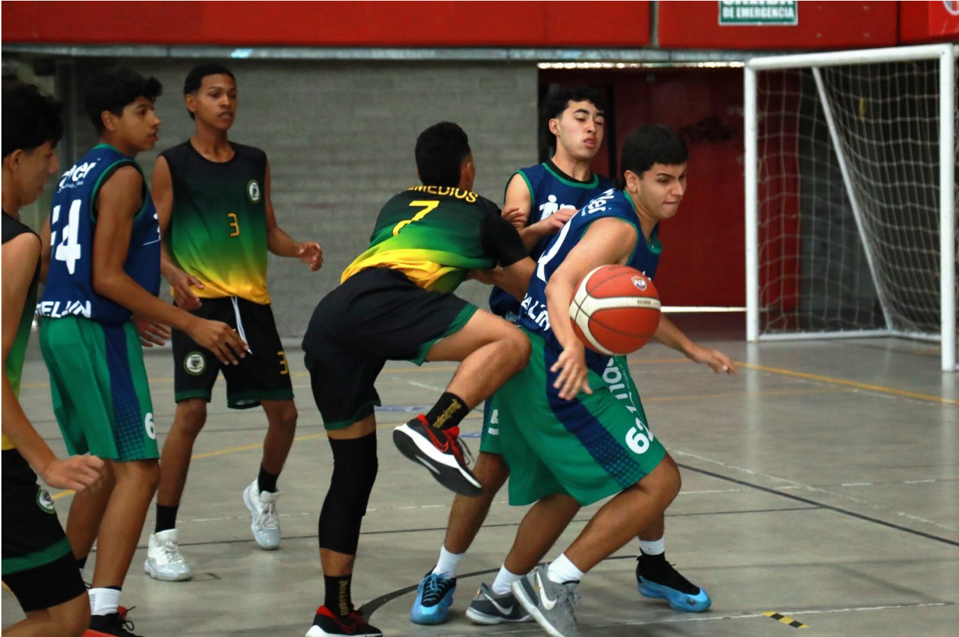
(Juego de baloncesto masculino entre los quintetos de Remedios 37 – Medellín 53.).