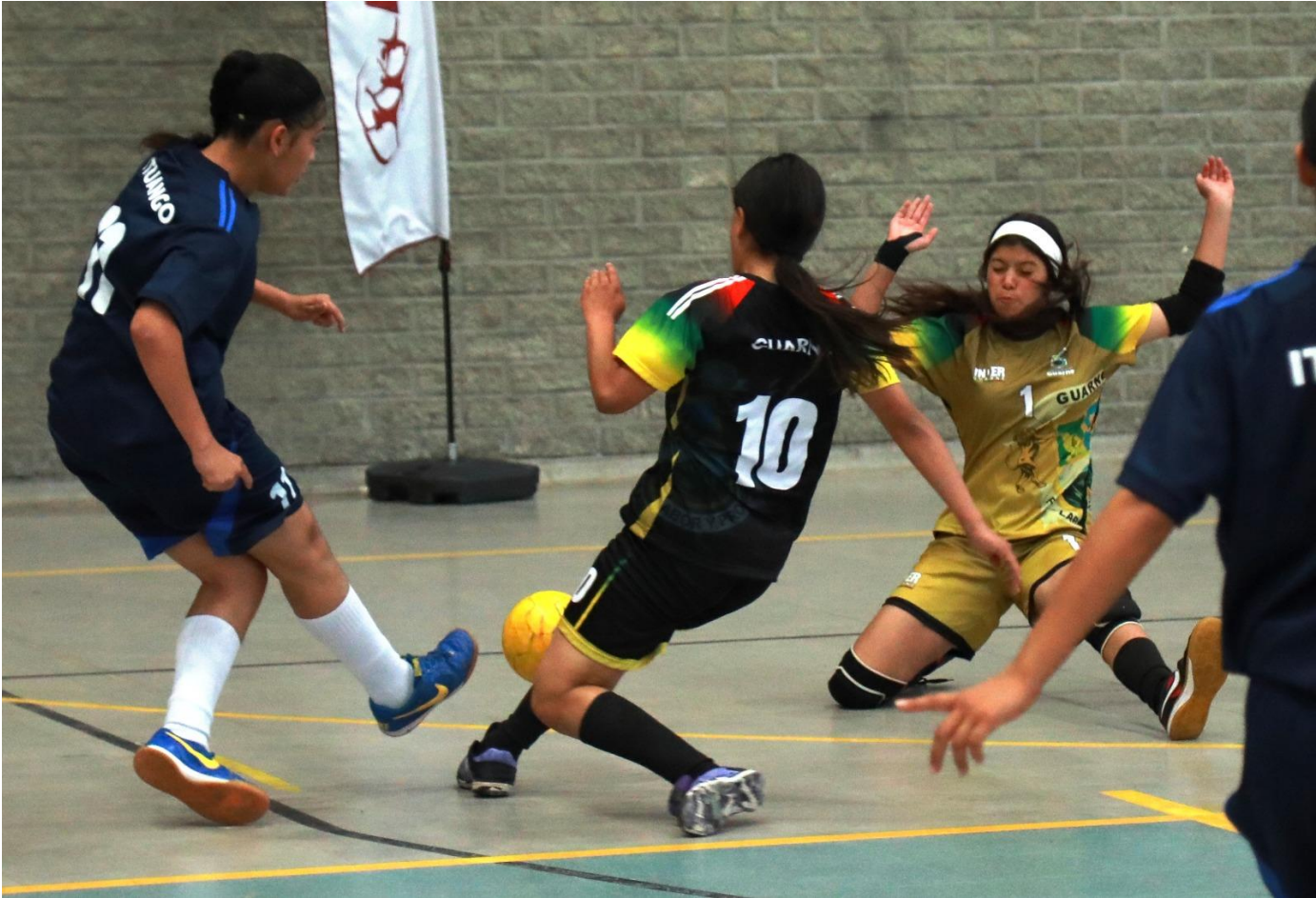
(En fútbol de salón femenino, Guarne de Oriente venció 4-3 a Ituango de Norte.).