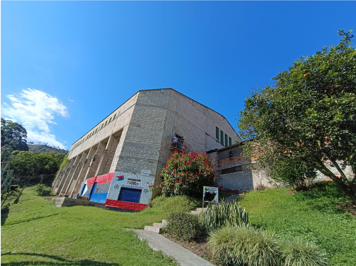
(Coliseo municipal de Betania.).

Tras el foro virtual realizado el lunes 8 de septiembre, así quedaron los grupos de competencia en los deportes que se jugarán en Betania: baloncesto, fútbol, fútbol de salón y voleibol mixto.