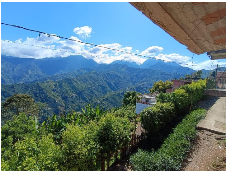
(Farallones del Citará. Foto de @loaizal59).