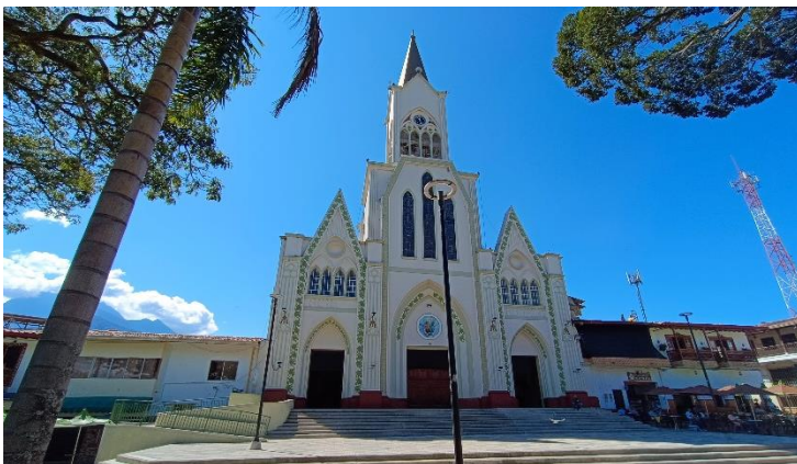
(Arriba, templo parroquial de Betania y abajo, árboles del parque.)