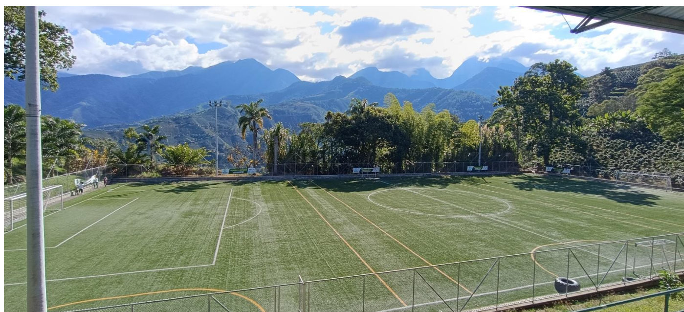
(Estadio municipal de fútbol de Betania.).