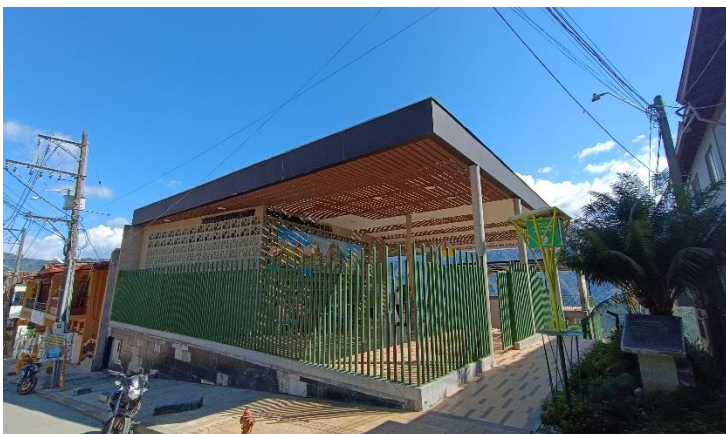
(Parque Educativo de Betania.).