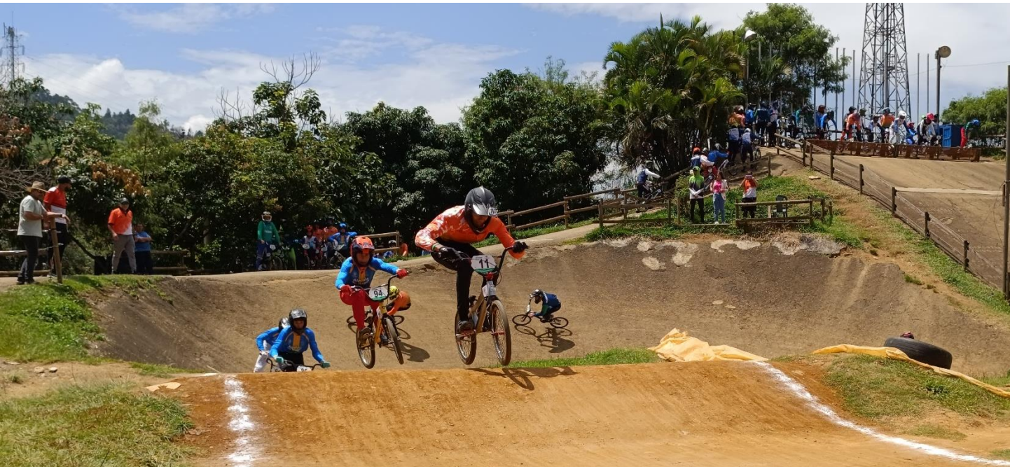
(En BMX va liderando el torneo, tras una prueba, el equipo de Itagüí.).