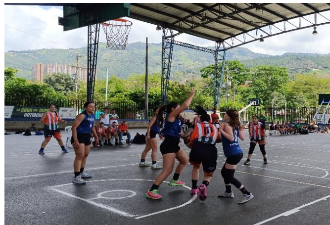
(Medellín 44 – Envigado 7 en baloncesto femenino. Foto de @loaizal59)

8:00 am Cuarta Ronda 1:00 pm Quinta Ronda