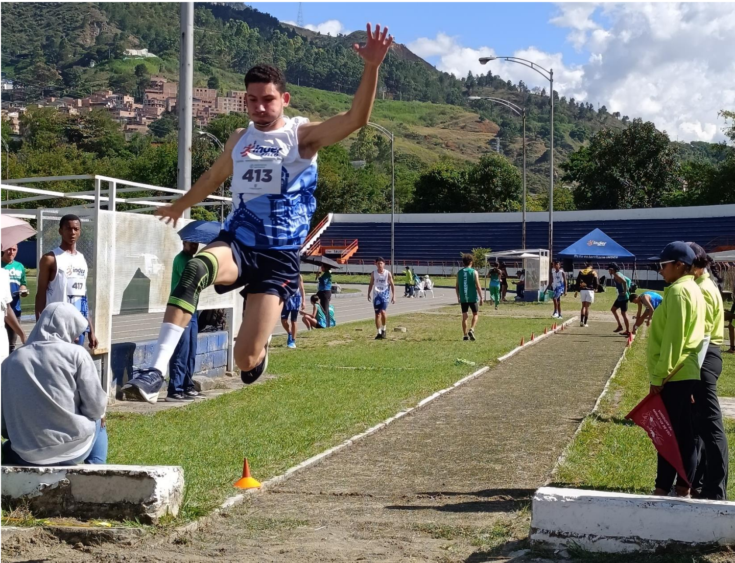
(Atletismo en acción en Bello.).