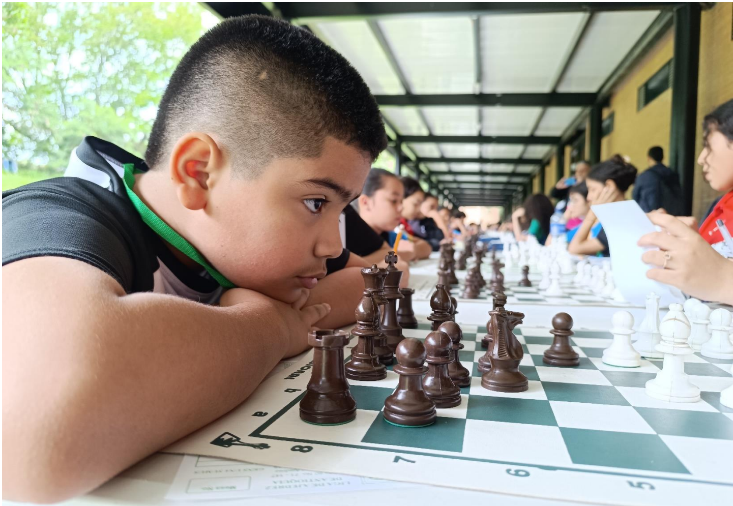
(Pensando la jugada en el deporte ciencia. El torneo del deporte ciencia finaliza este miércoles en horas de la tarde.)

Cumplidas tres rondas del torneo de ajedrez, tableros de Itagüí, Envigado, Bello, Medellín y Sabaneta, van de líderes en las diferentes ramas y categorías: