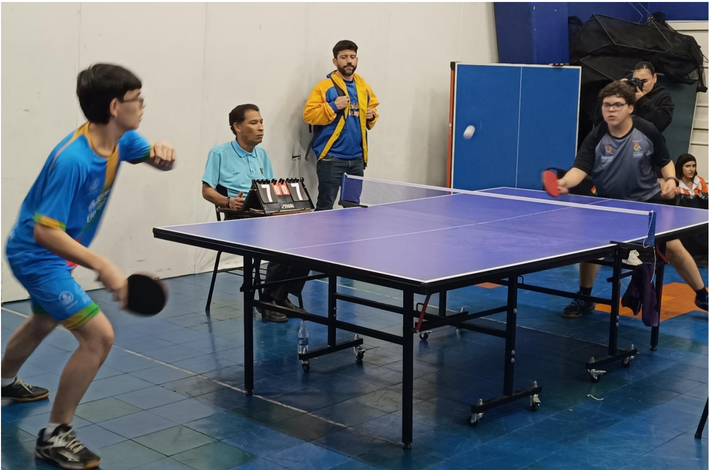
(En tenis de mesa, en la primera fecha, que fue en la modalidad de equipos, Medellín ganó las cuatro medallas de oro puestas en disputa.).