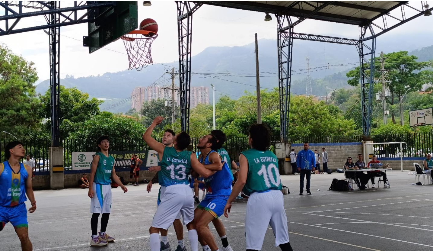
(Partida de baloncesto masculino entre La Estrella 42 – Itagüí 44.).