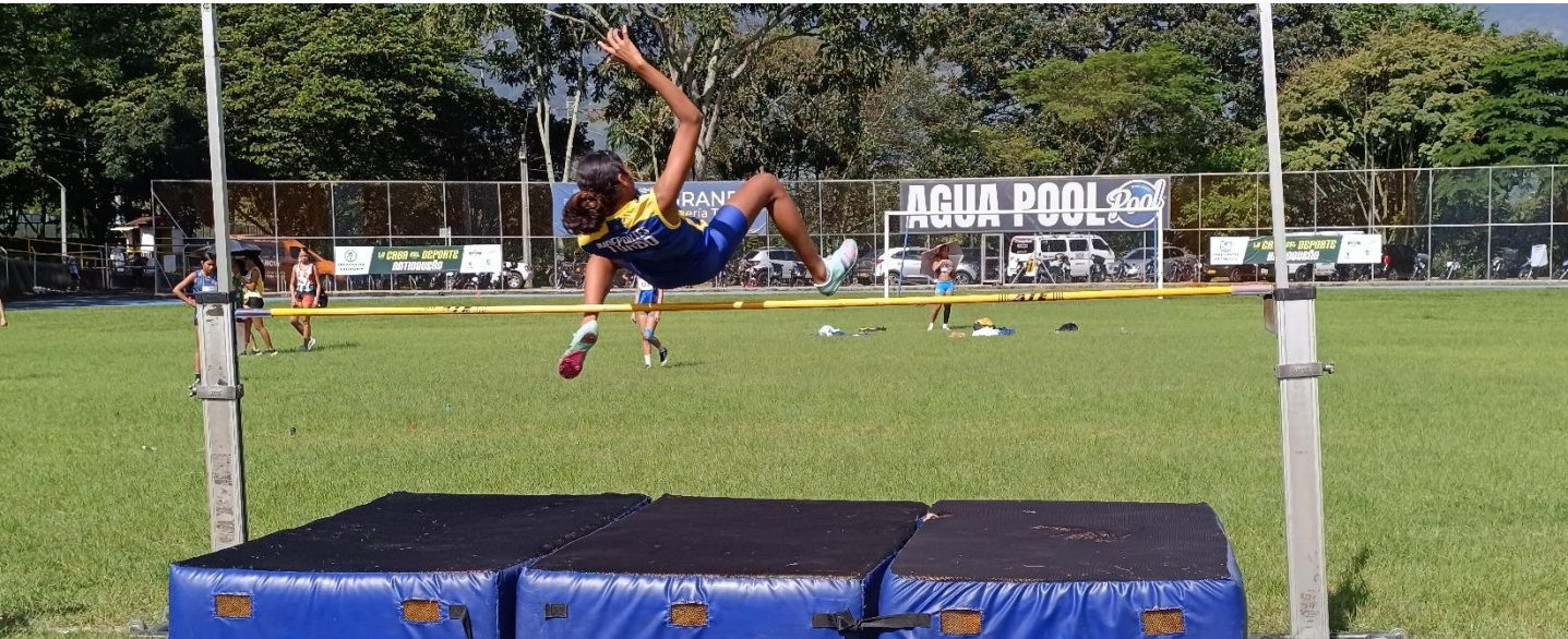
(Salto alto, rama femenina, en Girardota.).

9:00 am Tercera ronda – clásico – masc y fem 2:30 pm Cuarto ronda – clásico – masc y fem