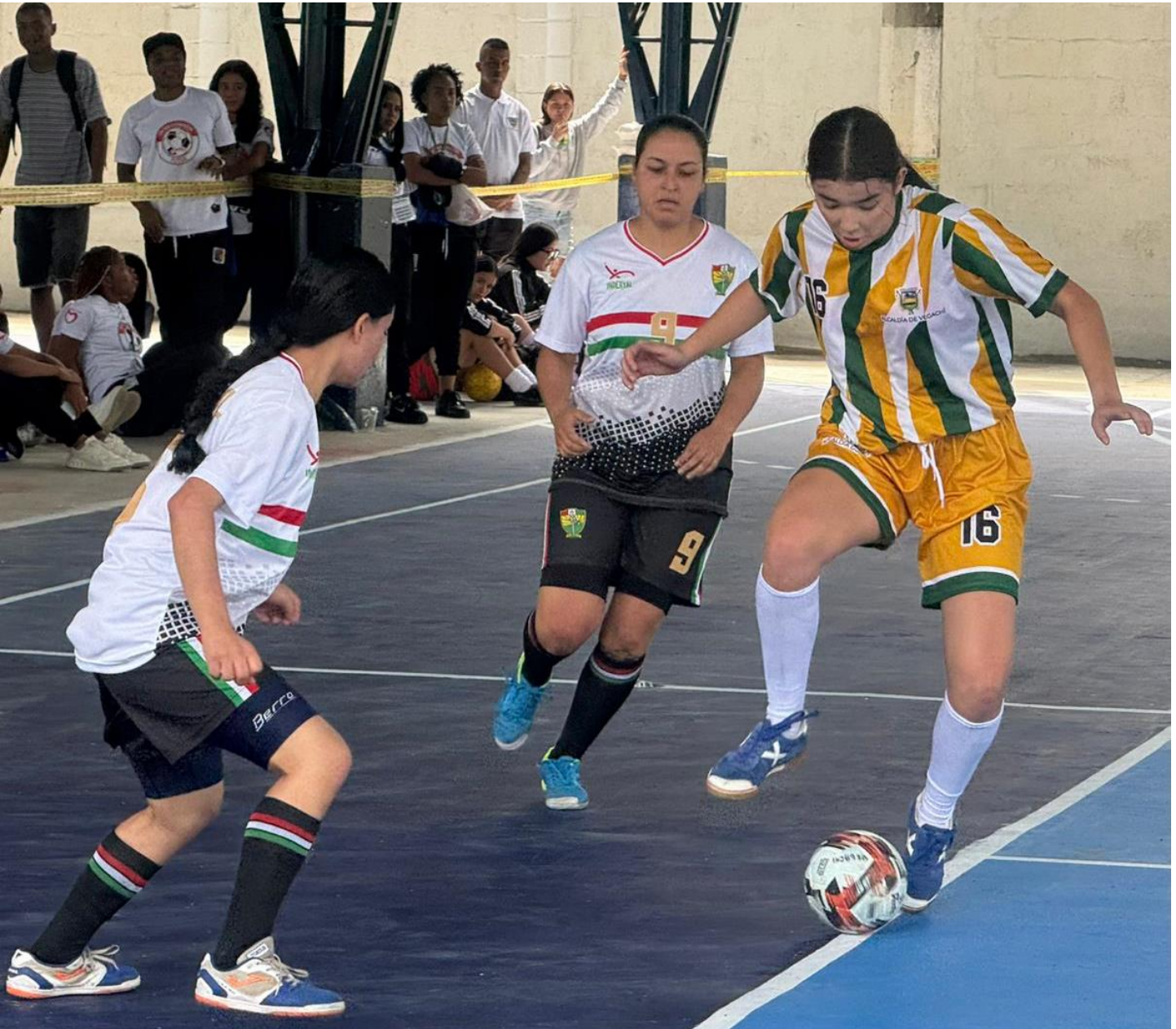
(Otra secuencia del partido Vegachí 2 -Yarumal 4 de futbol de salón en Copacabana.).

En la placa auxiliar de la Unidad Deportiva de Copacabana comenzaron este martes 25 de noviembre las primeras actividades del campeonato de tejo, uno de los deportes oficiales de la final de los Juegos Deportivos Departamentales 2025.