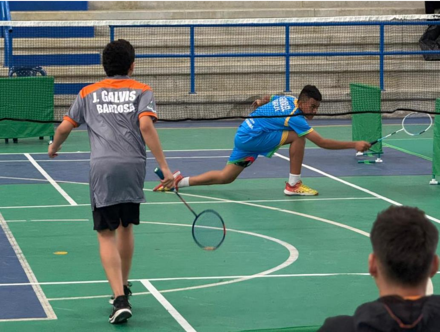
(Extensa y emotiva fue a jornada de bádminton, primera fecha en Girardota, el martes 25 de noviembre. Las partidas de hombres y mujeres fueron en la modalidad individual.).

En el coliseo Metropolitano de Girardota se cumplió, el martes 25 de noviembre, la primera fecha del torneo de bádminton, en masculino y femenino, modalidad individual, de los 48° Juegos Deportivos Departamentales “Indeportes Antioquia” 2025, “Juego de Todos”.