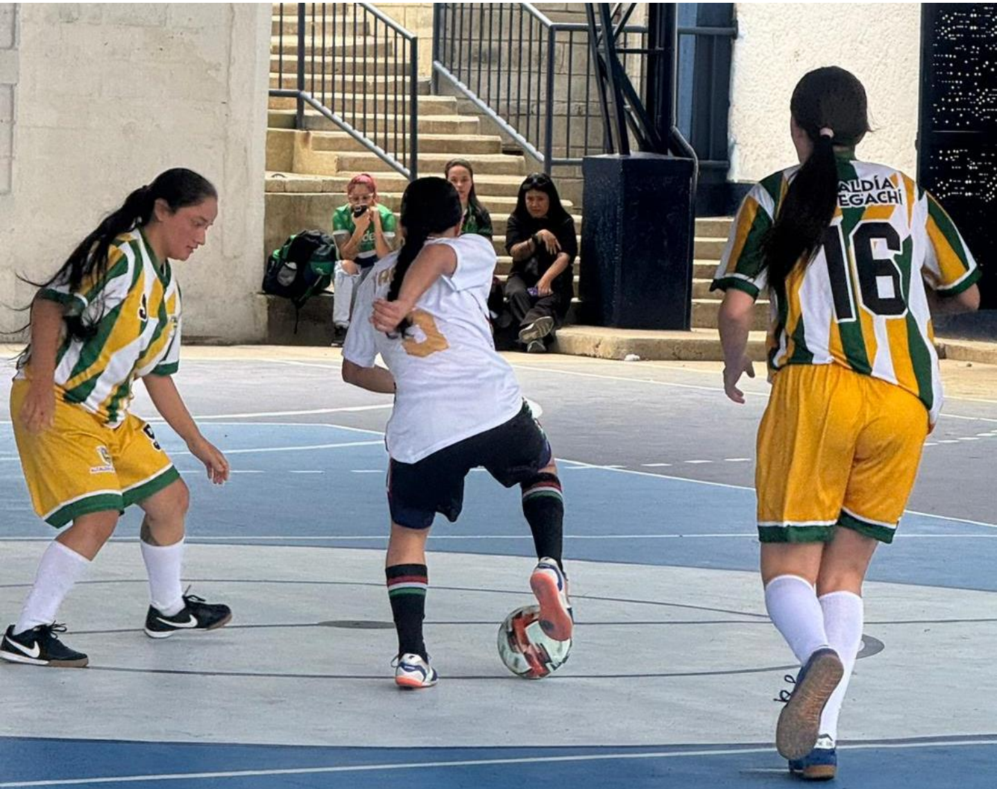
(Partido de fútbol de salón en Copacabana entre los quintetos de Yarumal 4 -Vegachi 2.).