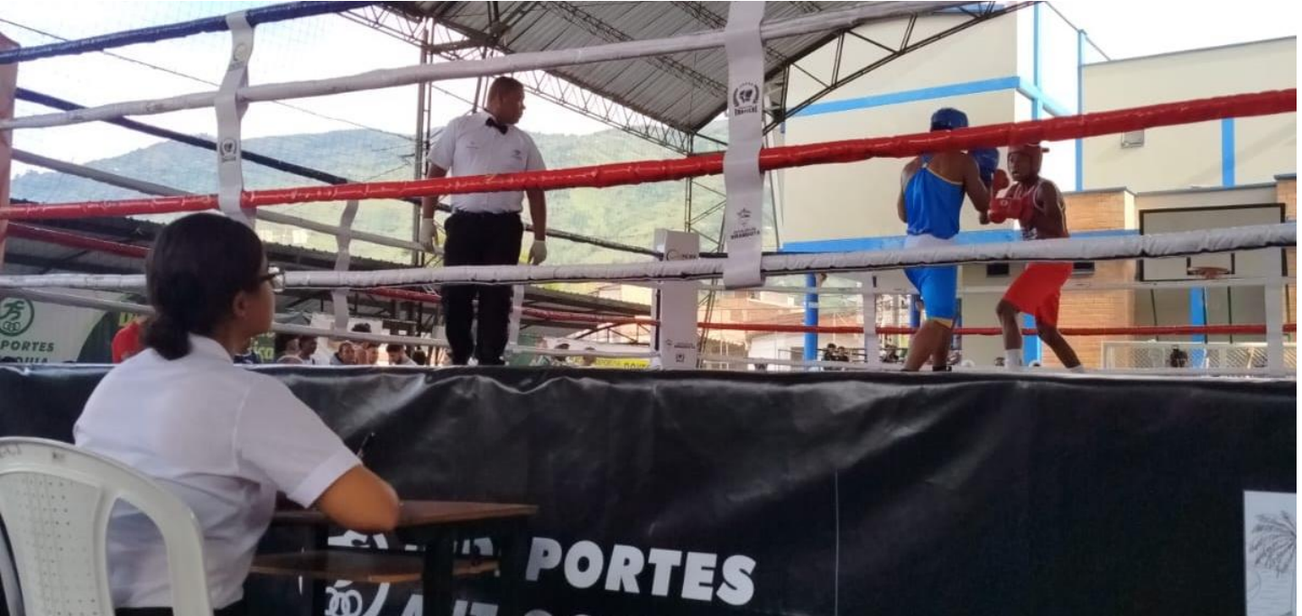
(Aquí uno de los 60 combates realizados en la 1ª jornada de boxeo en Girardota.).