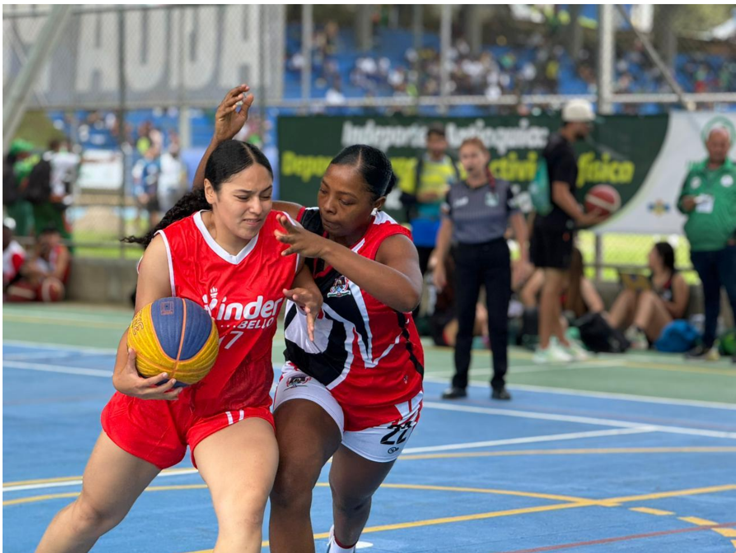
(Baloncesto 3 x 3, deporte que está en exhibición en los 48° Juegos Deportivos Departamentales “Indeportes Antioquia” 2025. Abajo, atleta del municipio de Arboletes.).

ganadora al sumar cinco medallas de oro. Con tres títulos aparecen Guarne, Carepa y Sabaneta, que dejaron en alto el nivel técnico de sus deportistas.