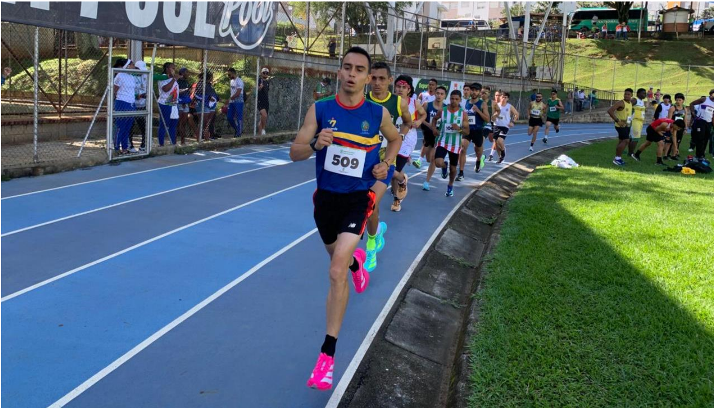
(Secuencia de una competencia de atletismo en la pista del estadio de Girardota.).