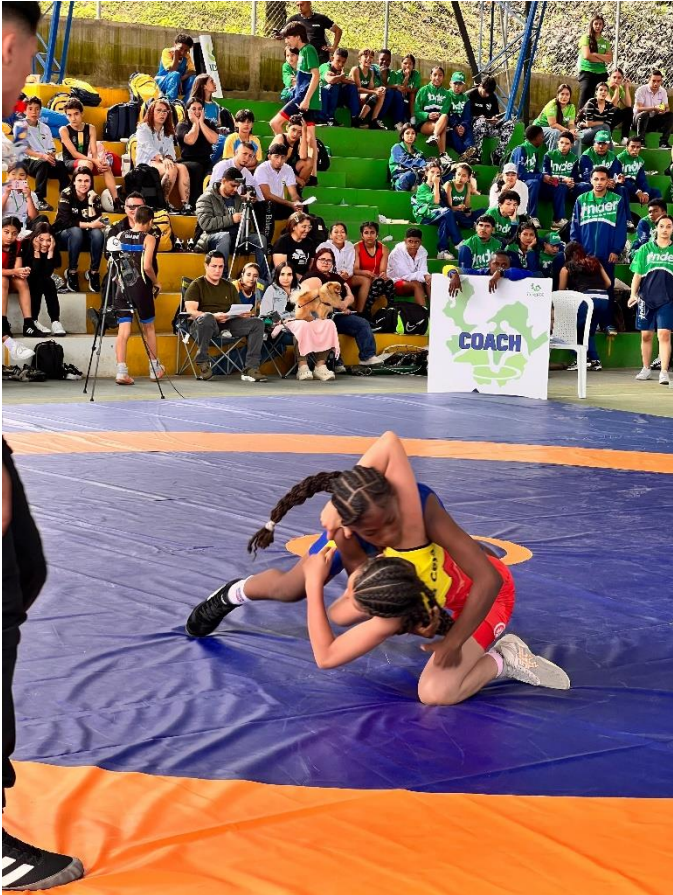
(Combate de lucha. El torneo es liderado por Medellín.).