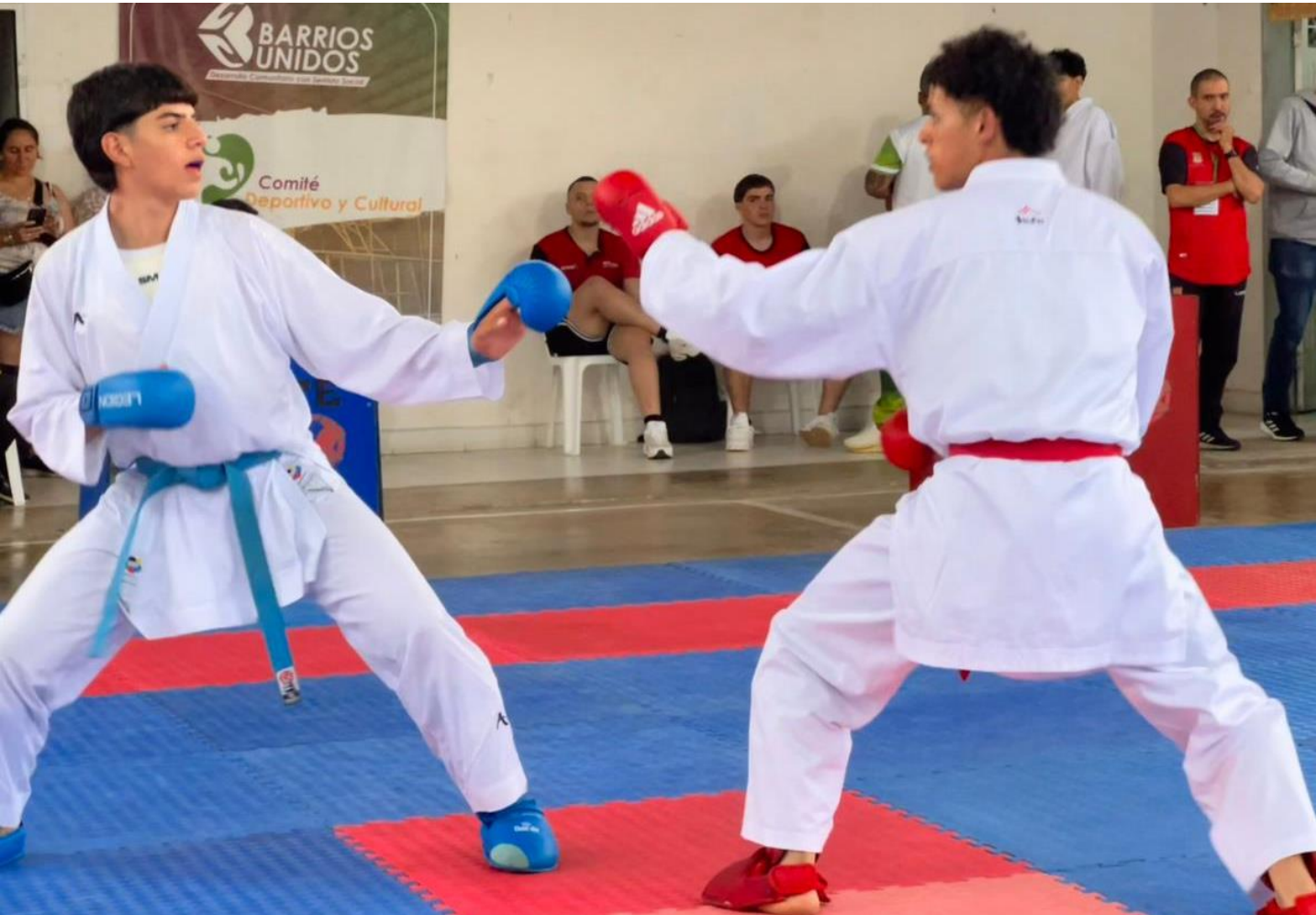
(Karate do en acción en la cámara de la reportera gráfica de Indeportes Antioquia Diana Cristina García Flórez. El torneo de karate do, que termina este miércoles 3 de diciembre es liderado por el equipo de Bello con 9 medallas de oro. Medellín es segundo con cinco preseas doradas).

La medallería final y los resultados del torneo de paranatación se pueden consultar dando clic AQUÍ o desde el título de Paranatación .