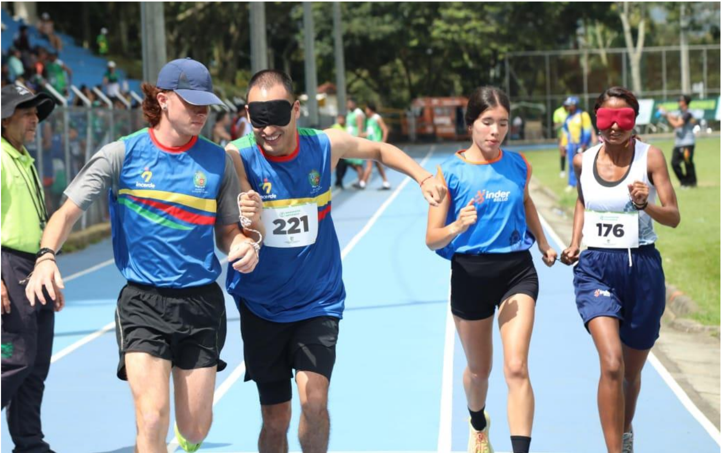
(Trabajo en equipo en paratletismo. El guía y guiado rumbo a la meta.)

8:00 a 8:20 am-Turno 1 8:20 a 8:40 am-Turno 2 8:40 a 9:00 am-Turno 3 9:10 am-50 m BF – Clasificatorio - 200 m AP - Clasificatorio 3:00 a 3:20 pm-Turno 1 3:20 a 3:40 pm-Turno 2 3:40 a 4:00 pm-Turno 3 4:10 pm-100 m SF-Final - 200 m BF-Directa - -4 x 50 m AP-Final