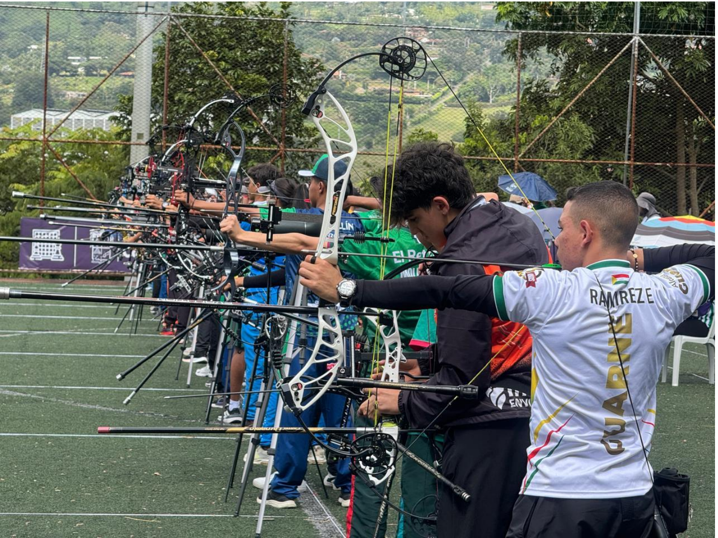
(Tiro con arco en Copacabana. El torneo lo lidera Medellín.).