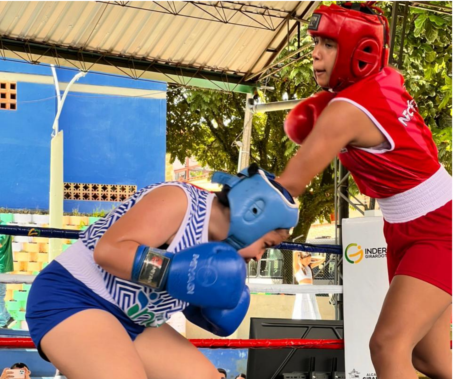
(Apartadó fue el ganador del torneo de boxeo, mientras que Medellín fue segundo.).