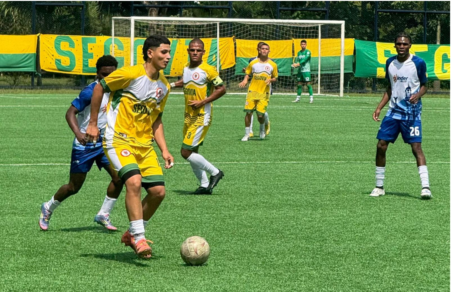
En acción los oncenos de Segovia y Bello. El partido finalizó 3 por 3.