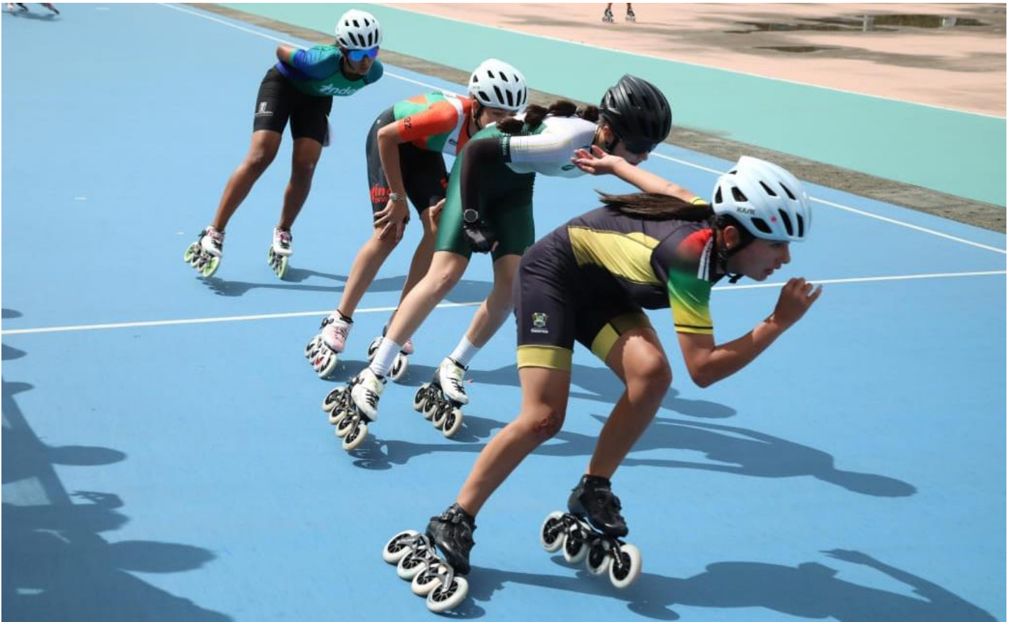
(Con el título para Envigado se cerró el torneo de patinaje de los 48º Juegos Deportivos Departamentales “Indeportes Antioquia” – 2025. Los envigadeños sumaron 7 oros por 6 de Rionegro.).

Programación del miércoles 3 de diciembre de 2025.