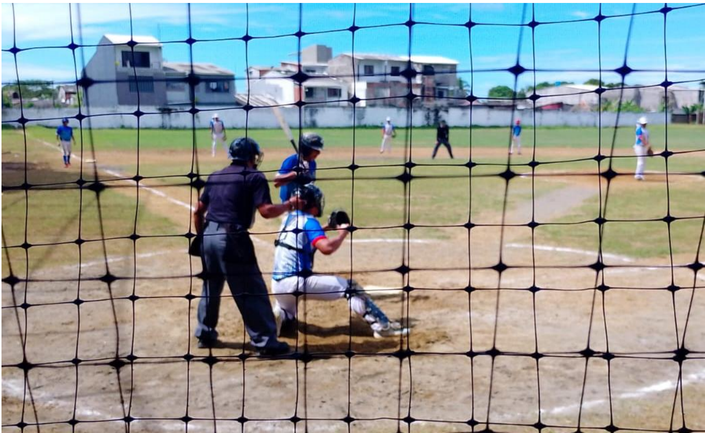
(En béisbol en Arboletes, la novena de Medellín fue la campeona tras vencer a su similar de Necoclí por 8 carreras a 3.).