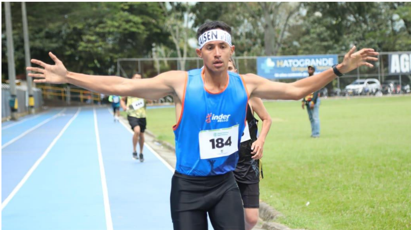
(Deportista de paratletismo en acción. El torneo de esta disciplina es liderado, en el momento, por la representación de Bello con 9 medallas de oro. En el segundo lugar va Itagüí con 8.).