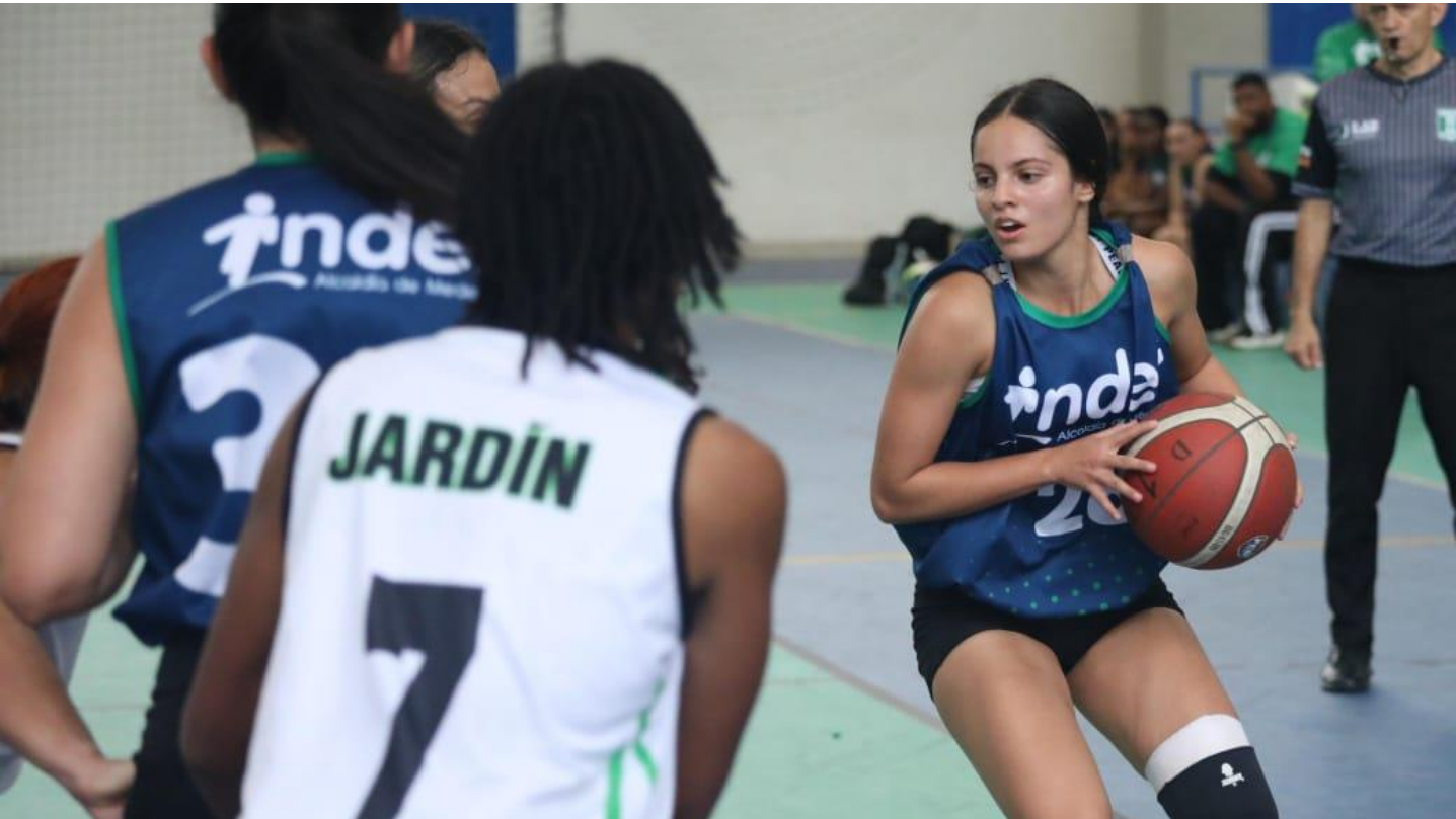
(Imagen del partido de baloncesto entre Jardín 52 vs Medellín 43.).