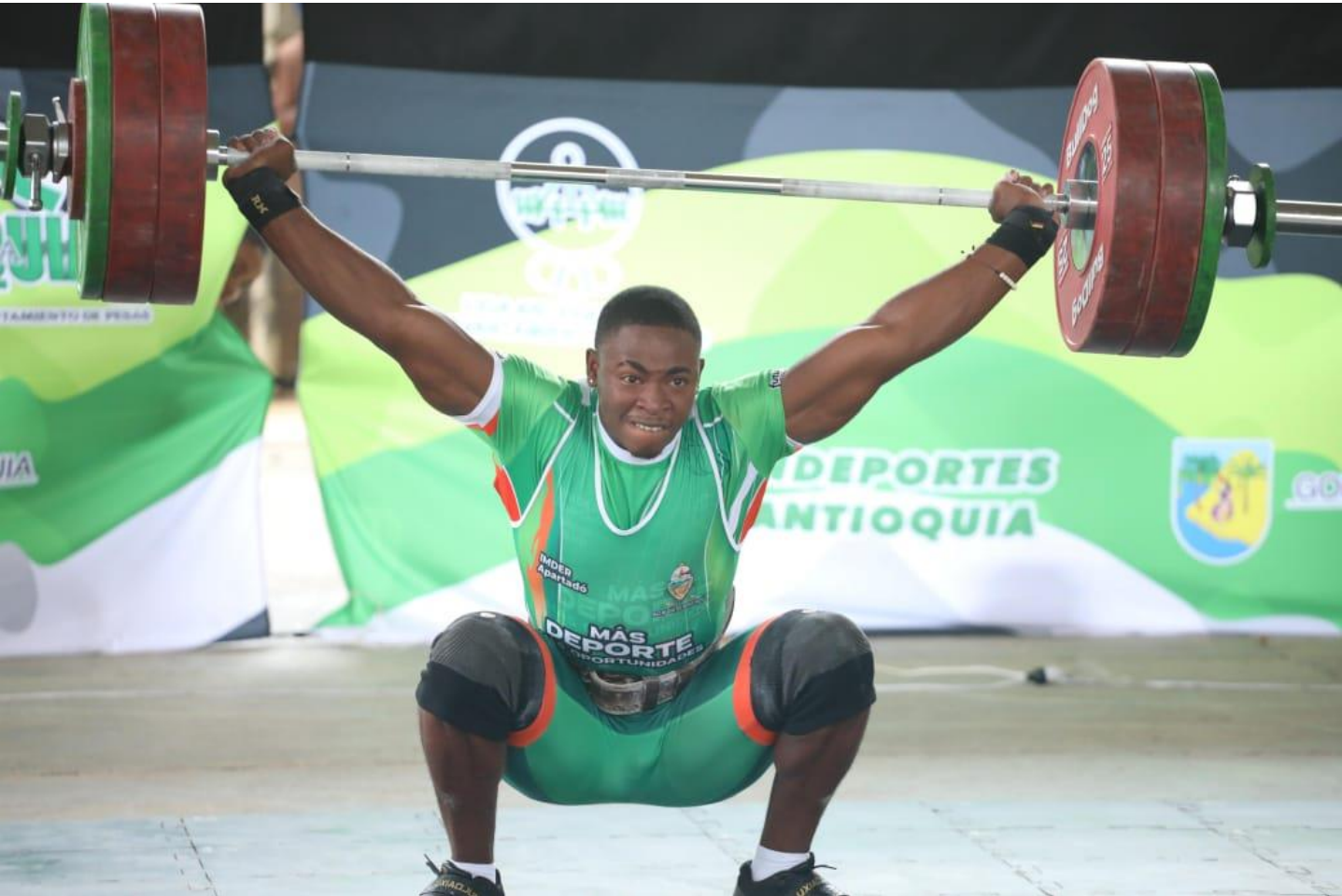
(El equipo de Apartadó pasó a liderar el torneo de levantamiento de pesas, una fecha del final. Ahora los del Río de Plátano" suman 24 medallas de oro, 10 de plata y 10 de bronce, por 24oros, 6platas y 4 bronce de Guarne que es segundo.).