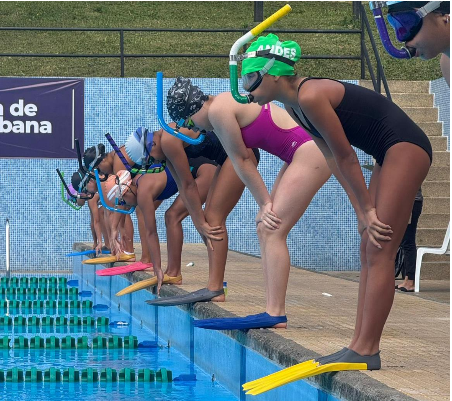
(Este jueves 4 de diciembre finaliza en Copacabana el torneo de actividades subacuáticas.).

Medellín y Jardín ocupan las posiciones 1 y 2 del medallero de ciclismo, después de cumplidas dos pruebas ( circuito y ruta ), en el marco de los Juegos Deportivos Departamentales “ Indeportes Antioquia ”. En ciclismo solo falta la competencia CRI que dará cuatro preseas de oro.