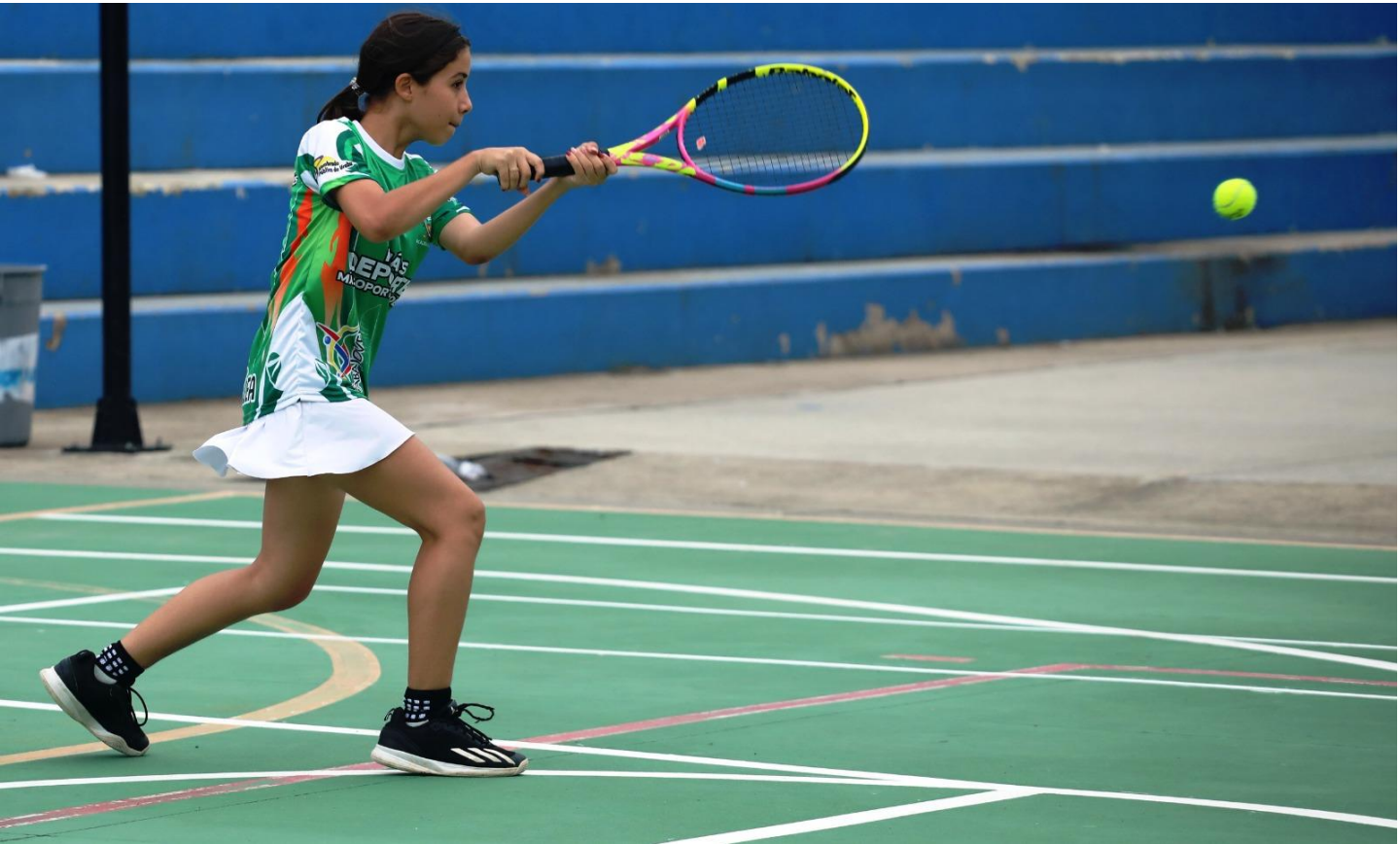
(El torneo de tenis de campo se extenderá hasta el viernes 5 de diciembre. Foto de Rodrigo Mora Quiroz de Indeportes Antioquia).