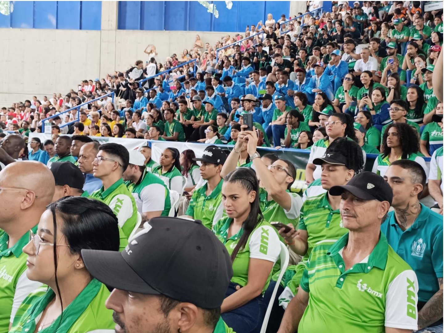
(Estamos a dos días del cierre de las justas deportivas de Antioquia. Aquí un recuerdo de lo que fue la apertura.)