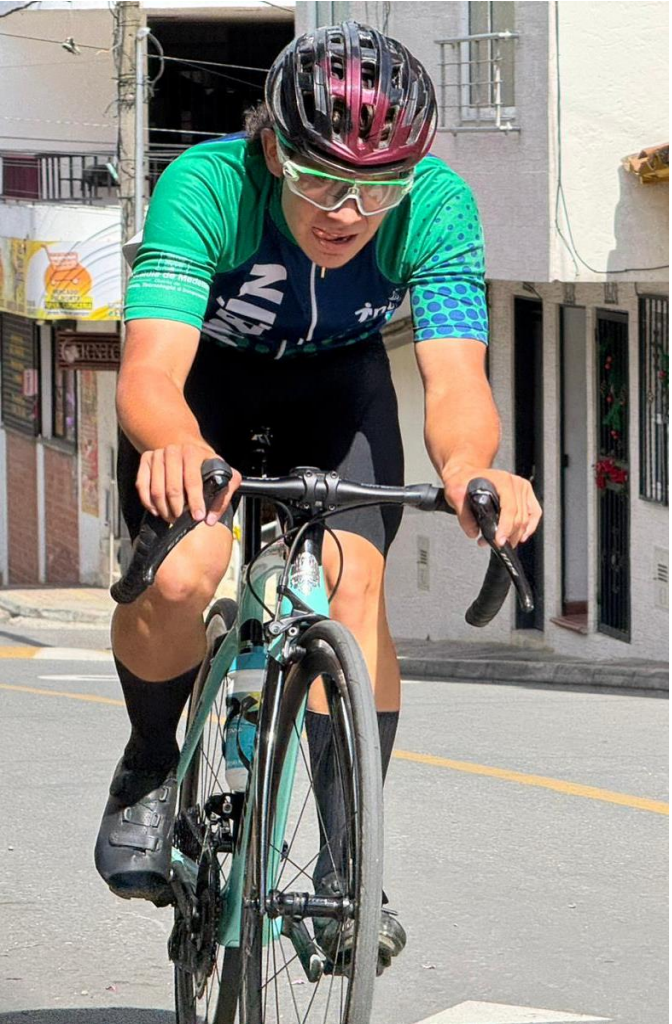
(Ciclismo en acción.)