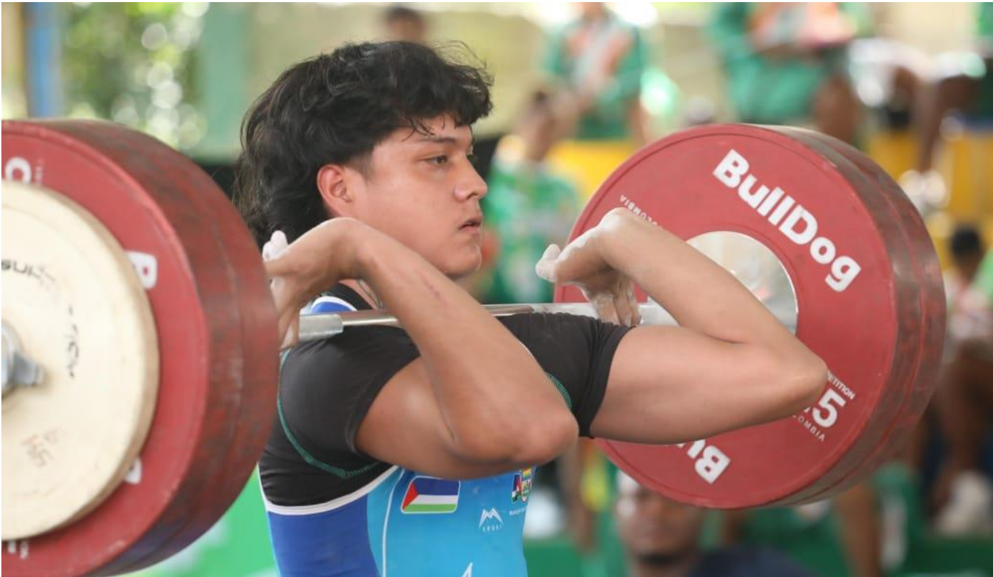
(Cayó el telón de levantamiento de pesas en el marco de los 48° Juegos Deportivos Departamentales “Indeportes Antioquia” y tras el cierre del torneo el campeón fue el equipo de Apartadó con 31 oros, 21 platas y 11 bronce.).

Sobre sus favoritos para avanzar en la competición, añadió Camilo: “he visto buenos equipos como Rionegro, Copacabana, Apartadó y Bello. Por los resultados de hoy, le voy a Apartadó y Segovia”. También habló sobre la pasión futbolera de su municipio: “Zaragoza es un pueblo que le gusta mucho el fútbol, tiene mucho amor por él”.