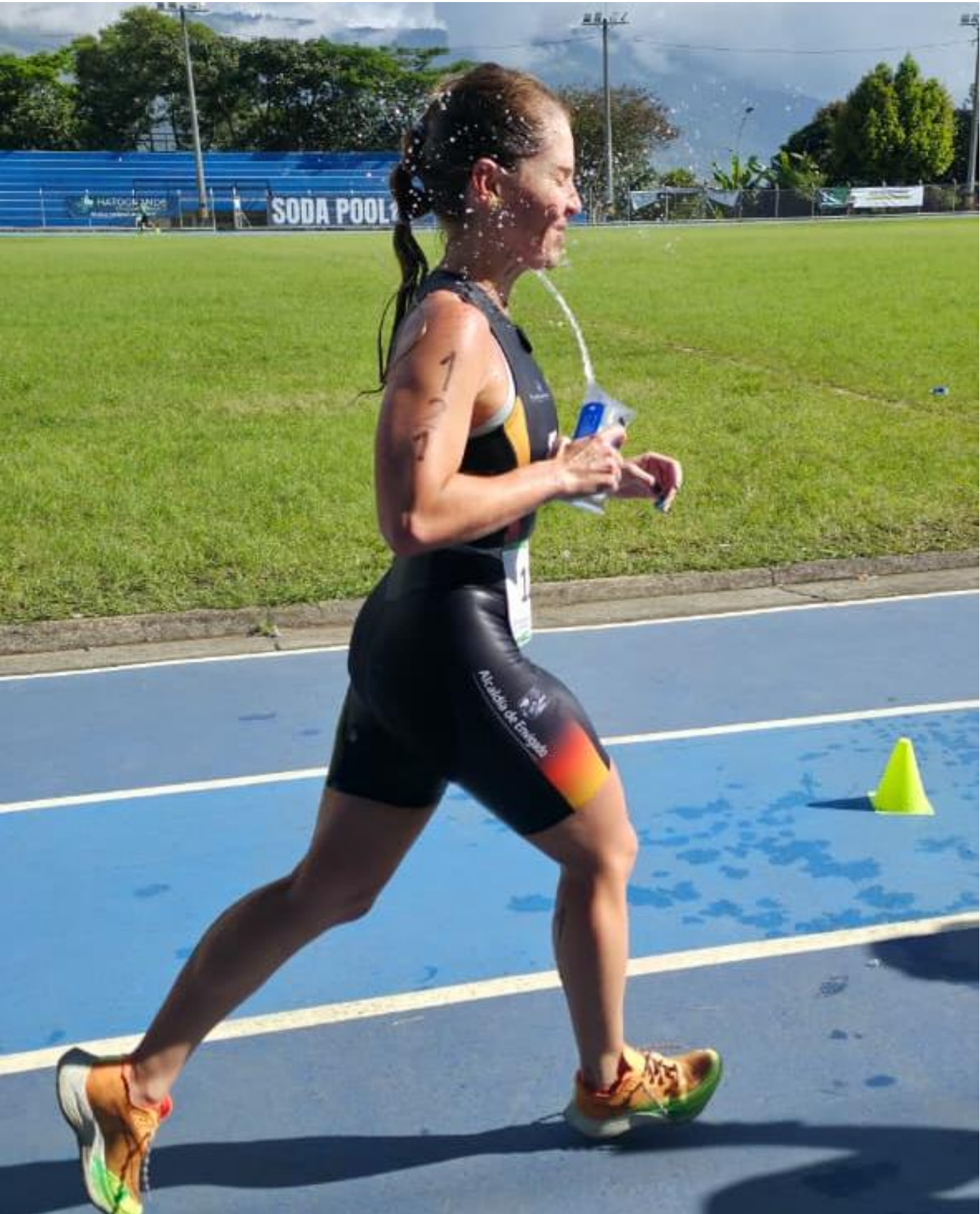
(Triatleta del municipio de Envigado en la competencia del miércoles 3 de diciembre en Girardota. La exhibición inicial fue ganada por deportistas de Rionegro en femenino y Envigado en masculino.).