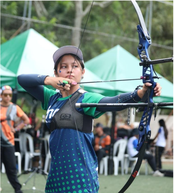
(Tiro con arco en acción, disciplina liderada por Medellín.).