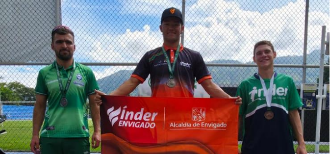
(Pódium de triatlón masculino. Foto de Martha Cecilia Pemberty Mazo)

Continúan las competencias de tenis de campo en Girardota. De acuerdo con la agenda prevista para el jueves 4 de diciembre y lo que pasó el miércoles 3, están en la recta final las competencias en sencillos y van a comenzar los dobles.