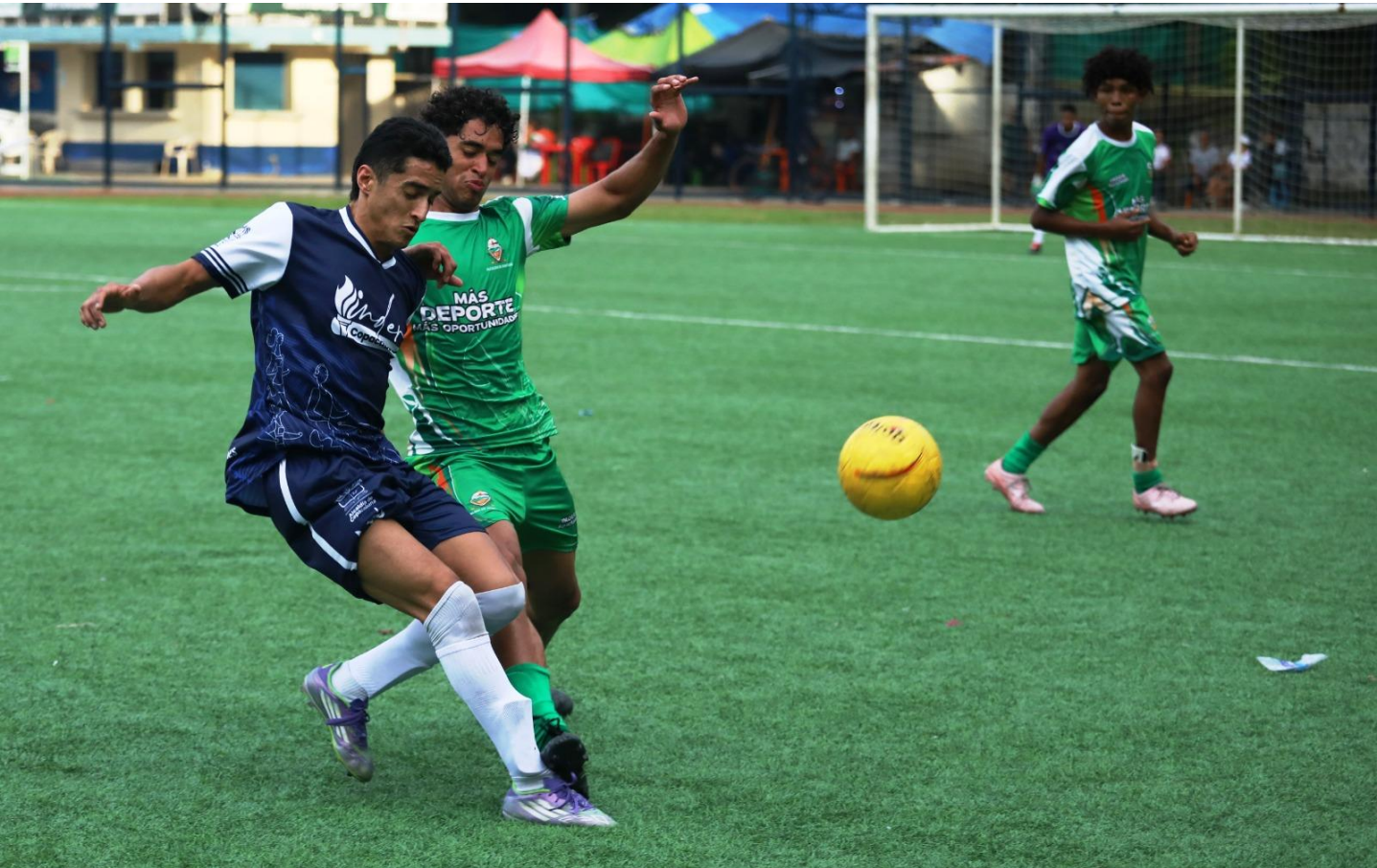
(Partido de fútbol entre Copacabana 1 – Apartadó 1 realizado en el municipio de Copacabana en el norte del Valle de Aburrá.).

8:00 a 8:20 am- Turno 1 8:20 a 8:40 am- Turno 2 8:40 a 9:00 am- Turno 3 9:10 am Finales 50 m BF - 50 m AP- 4 x 100 m BF