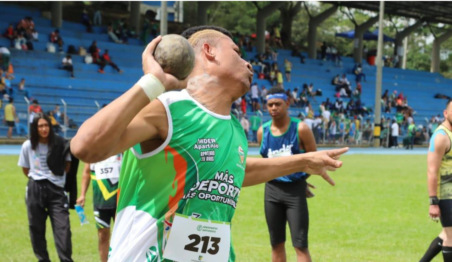
(Lanzamiento de la bala en paratletismo. En el torneo de paratletismo Envigado suma 44 oros, Itagüí 41, Medellín 29, Apartadó 28 y Rionegro 16. Foto de Rodrigo Mora Quiroz de Indeportes Antioquia).

(Tomado del sitio web Deportesant de Indeportes Antioquia, a las 22:15 horas del miércoles 3 de diciembre de 2025):