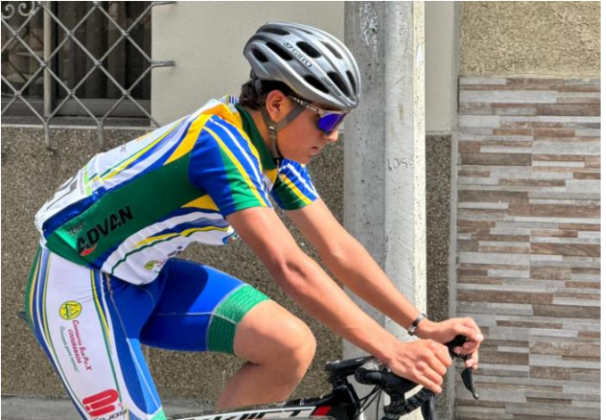
(Ciclista en la prueba de ruta. Foto de AEMM de Indeportes Antioquia).